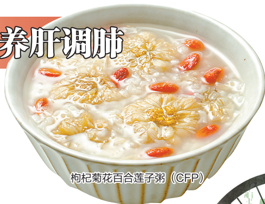
枸杞菊花百合莲子粥

做法:将枸杞、菊花、莲子、糯米同放锅中,加适量清水,大火开后改小火慢煮,30分钟后至米熟