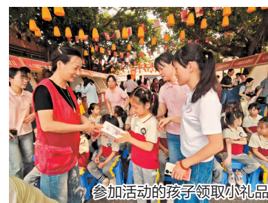
参加活动的孩子领取小礼品

本报讯(融媒体记者王盼琛 通讯员杨颖铭 文/图)为深化全民国家安全教育,强化辖区禁毒宣传教育实效,近日,泉州市公安局鲤城分局禁毒大队联合鲤中街道办事处、鲤中派出所、通政社区等单位,在泉州西街肃清门广场开展禁毒主题宣传活动,同步融入国家安全宣传,营造平安无毒的社区氛围。