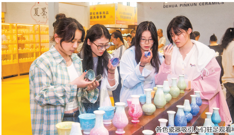
各色瓷器吸引人们驻足观看

本报讯(融媒体记者陈小芬 通讯员吴有森 陈春迎 文/图)4月17日,2026德化佛事用品暨茶器具春季展在泉州德化会展中心拉开帷幕。本次展会以打造佛事用品、茶器具原产地专业贸易平台为核心,