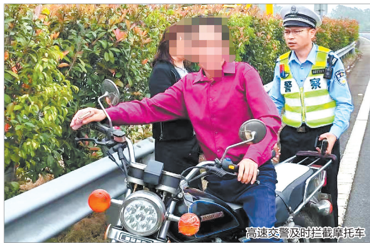
高速交警及时拦截摩托车

本报讯（融媒体记者林志安 通讯员刘闽华 文/图）日前，一辆摩托车在甬莞高速上逆向行驶，高速交警接到报警后火速前往处置，消除道路安全隐患。