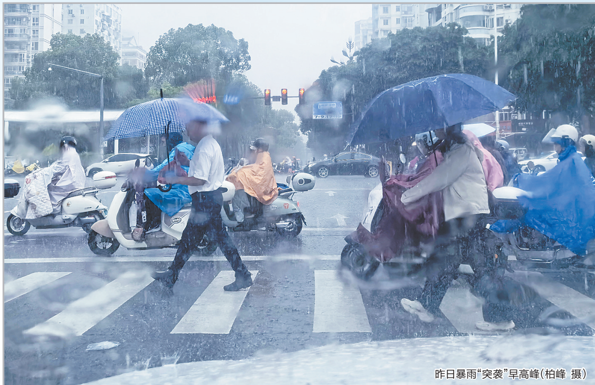
昨日暴雨“突袭”早高峰

今年“五一”小长假我市整体天气舒适,适合户外游玩、短途出行。在此也提醒有出游计划的市民,提前关注目的地实时天气,合理规划行程。