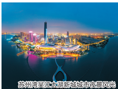
苏州湾吴江太湖新城城市夜景风光