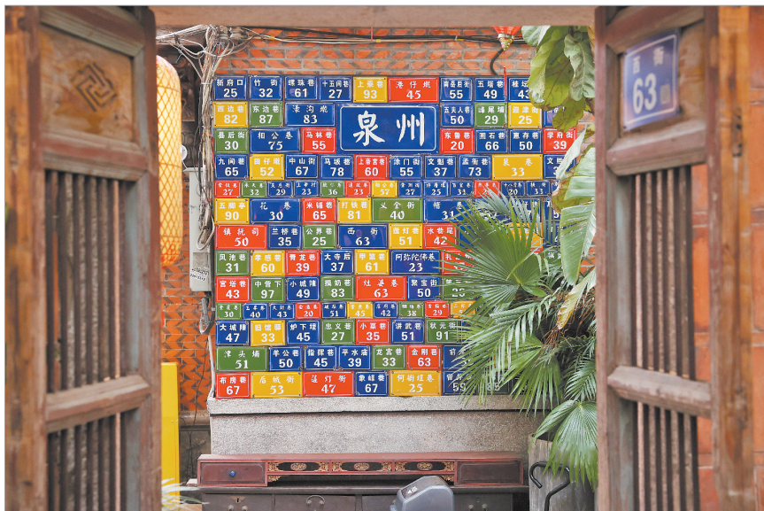
藏在西街角落里的泉州路牌