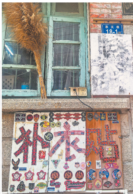
承天巷裁缝铺的“补衣贴”