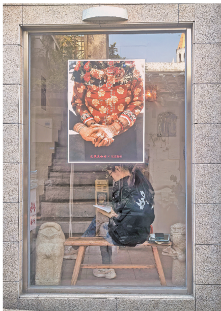
沟尾下巷商铺橱窗别有特色