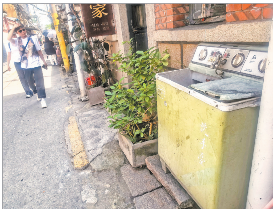
▲县后街洗衣机改装的洗手台