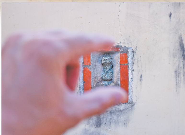
▲嵌在墙上的小石敢当