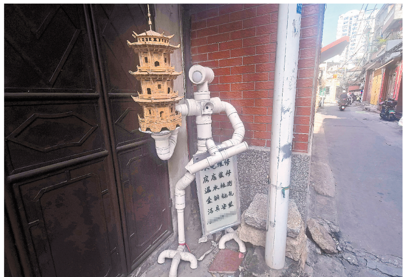
凤池巷的创意装置