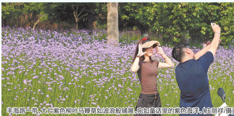
丰海路一带,大片紫色柳叶马鞭草如波浪般铺展,宛如童话里的紫色海洋。(庄丽祥/摄)