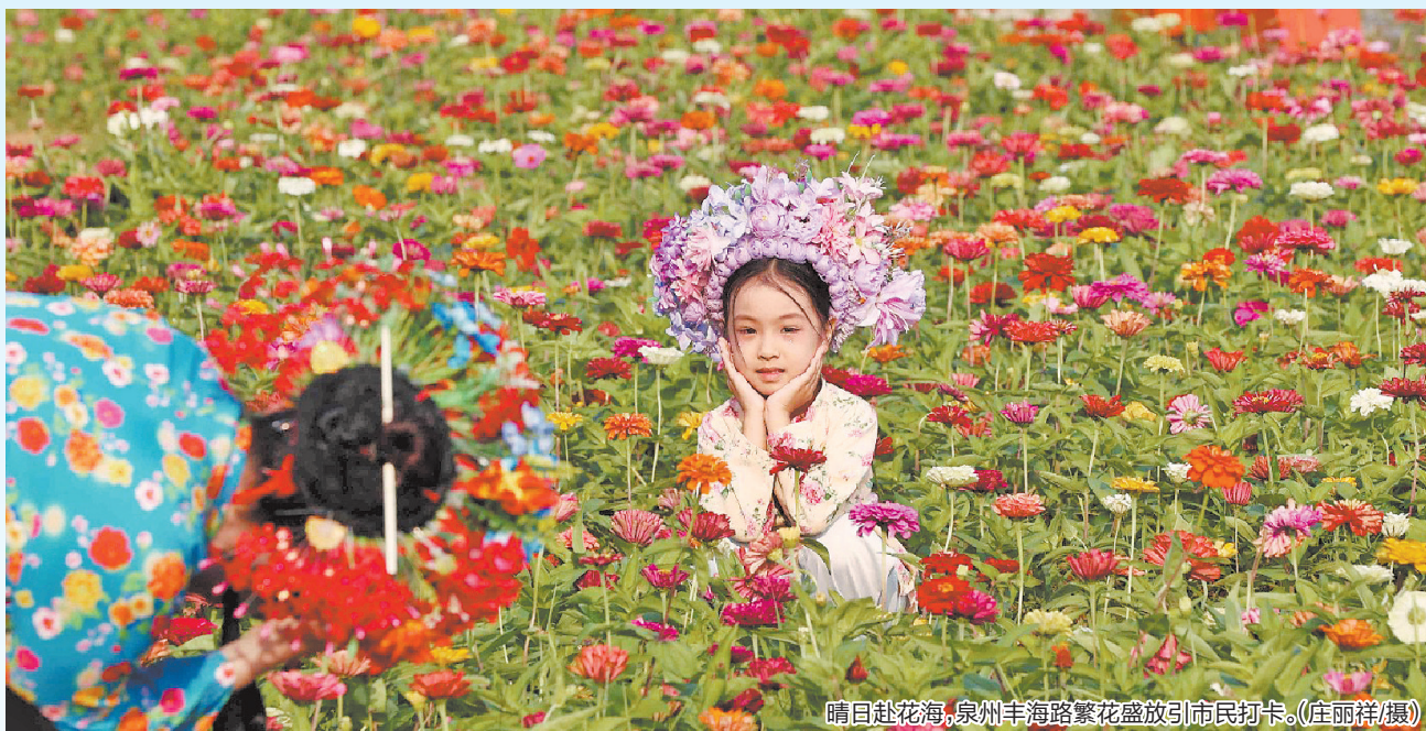
晴日赴花海,泉州丰海路繁花盛放引市民打卡。

春夏交际气温起伏较大,提醒市民朋友及时关注最新天气预报,适时增减衣物,谨防着凉感冒。