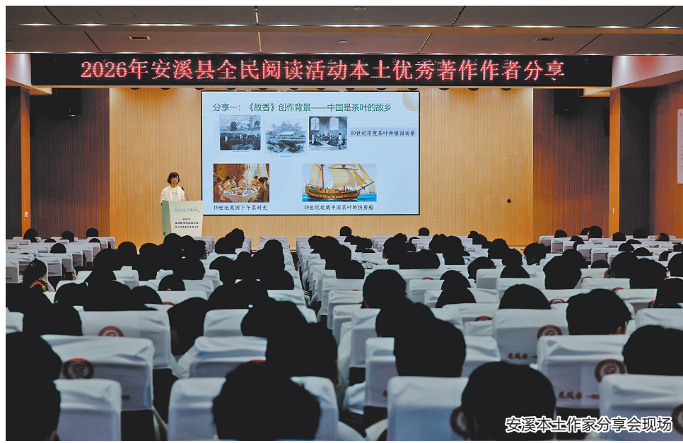
安溪本土作家分享会现场

据悉,安溪一中构建“三香四气”育人体系,打造立体阅读阵地,组建阅读导师团队,推动“家校社”协同育人。