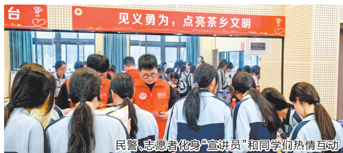
民警、志愿者化身“宣讲员”和同学们热情互动