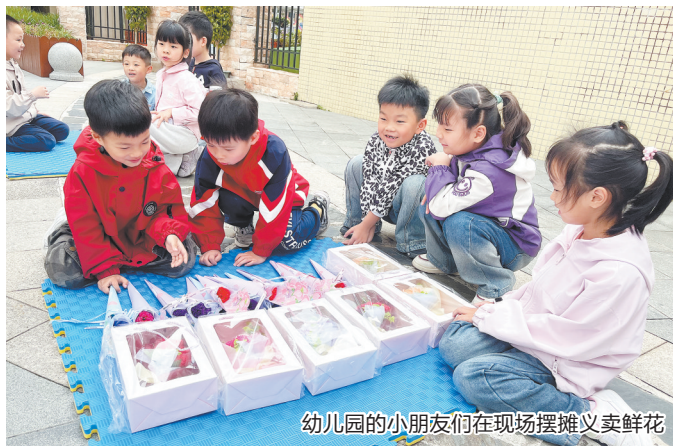
幼儿园的小朋友们在现场摆摊义卖鲜花

本报讯(融媒体记者邱丰 通讯员许灿辉 魏贤集 文/图)温情五月,馨香致敬母爱;爱心汇聚,公益助力助残。5月9日下午,为弘扬孝亲敬老传统美德,营造关爱、帮扶残疾人等弱势群体的良好社会风尚,由泉州市丰泽区残疾人联合会、华大社区居委会、华城社区居委会和泉州市爱心企业帮帮团志愿服务队联合举办的“以花为名·感恩母亲”爱心义卖助残公益活动在丰泽区温情启幕。