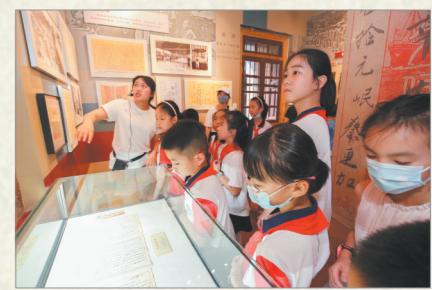
▲学生来到侨批馆研学