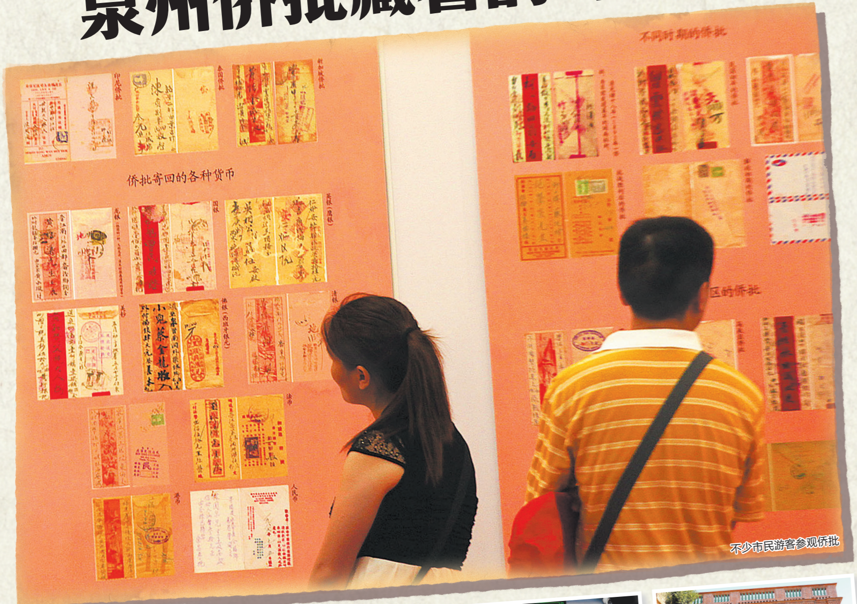
侨批寄回的各种货币