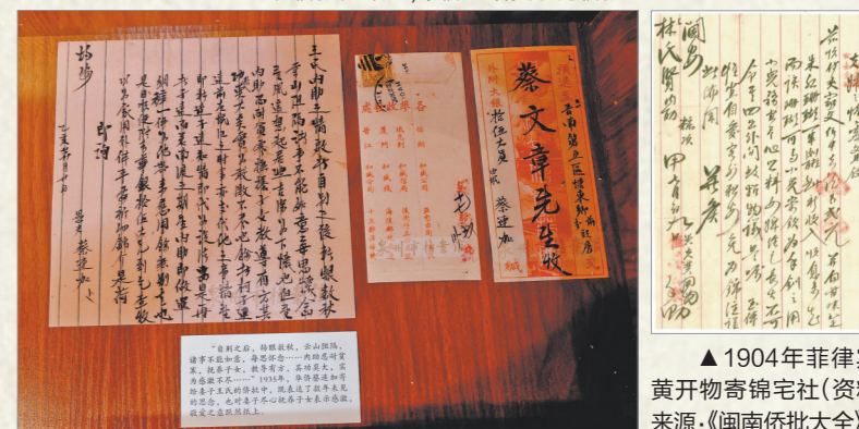
▲1904年菲律宾黄开物寄锦宅