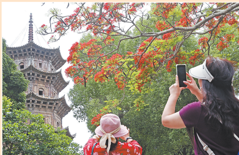
游人拍下凤凰花掩映下的古塔

连日来,泉州开元寺内凤凰花已悄然盛放,红绿相衬,古塔掩映其间,景色如画。火红花瓣与千年古刹相得益彰,吸引众多市民游客驻足拍照打卡。又是一年花开时,正是观赏好时机。