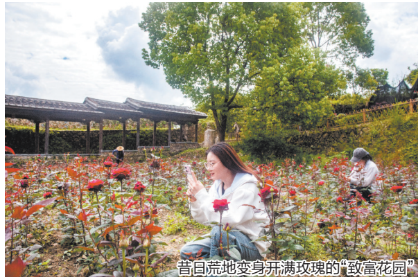
昔日荒地变身开满玫瑰的“致富花园”

早报讯(融媒体记者陈小芬 通讯员吴有森 文/图)近日,德化县桂阳乡桂阳村太平古寨的无刺即食玫瑰种植基地繁花盛开,香气怡人。当地立足乡村振兴实际,创新“党支部+公司+农户”联动模式,盘活闲置土地,发展特色种植,让昔日荒地变身“致富花园”。