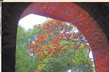
红砖与红花连成一片