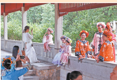
爱美的游客在廊下簪花留影