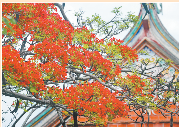
闽南建筑与火红的花瓣相映成趣

连日来,泉州开元寺内凤凰花已悄然盛放,红绿相衬,古塔掩映其间,景色如画。火红花瓣与千年古刹相得益彰,吸引众多市民游客驻足拍照打卡。又是一年花开时,正是观赏好时机。