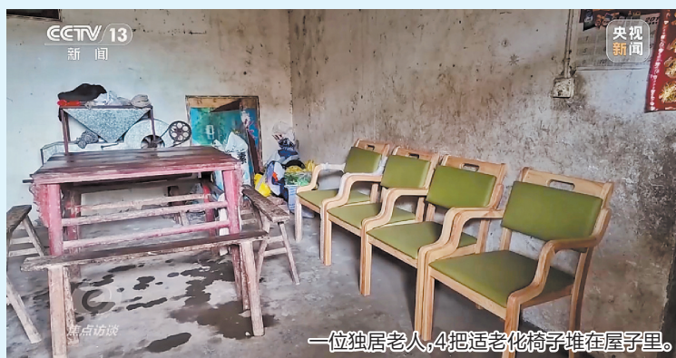
一位独居老人,4把适老化椅子堆在屋子里。

原来是2025年年初,四川省将“为有适老化改造需求的经济困难老年人家庭提供适当补助”列入了2025年全省“30件民生实事实施方案”。万源市民政局为了赶进度,从2025年10月23日与中标企业签订合同到12月8日结款,整个项目只用了40多天。