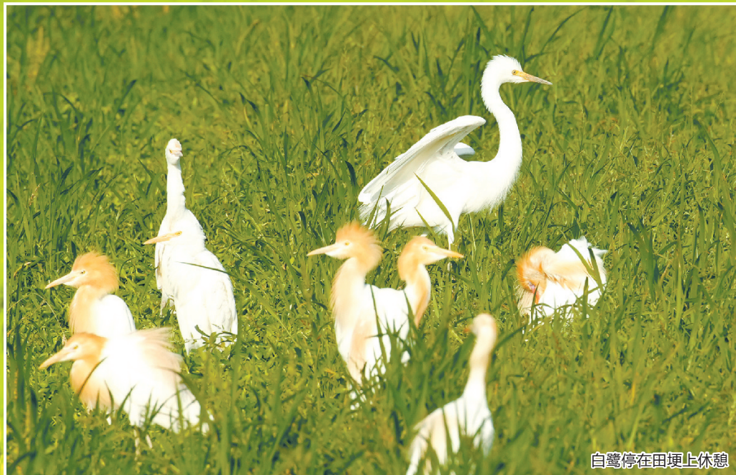
白鹭停在田埂上休憩