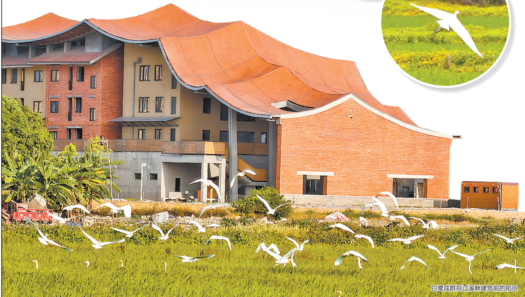
白鹭成群掠过溪畔建筑前的稻田