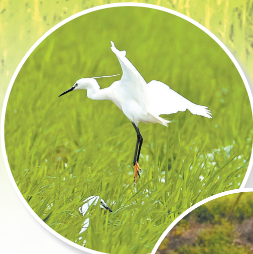
◀▼白鹭低空 穿行于田野之上, 羽翼轻盈飘逸。

溪边垂柳轻拂,水面波光粼粼,白鹭时而俯身掠过溪面,激起圈圈涟漪;时而与田间劳作的村民相伴,于农耕身影旁翩跹起舞,勾勒出一幅生动的人鸟共生画卷。红瓦村居点缀绿野,清溪流贯田园,白鹭栖居其间,自然生态与人文烟火交相辉映,漾开一片清新雅致的水乡韵致。