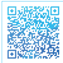
微信扫码查看详情

对象的数量超过学校招生计划数,则采取以落户到学校招生服务区域时间先后或划片分流等办法录取。没有被该校录取的,由区教育局统筹安排附近的有剩余学位的公办学校接收入学。如户口和住所分离是因政府项目拆迁房屋造成的,则可在政府安排的住所所属片区学校上学。