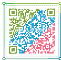
微信扫码查看详情

划,不得组织或变相组织文化科目测试。按《福建省人民政府办公厅印发关于进一步加强体育人才保障促进竞技体育高质量发展的若干措施的通知》(闽政办〔2024〕37号),试点开展青少年体育人才“一条龙”贯通培养,具体按市教育局要求执行。