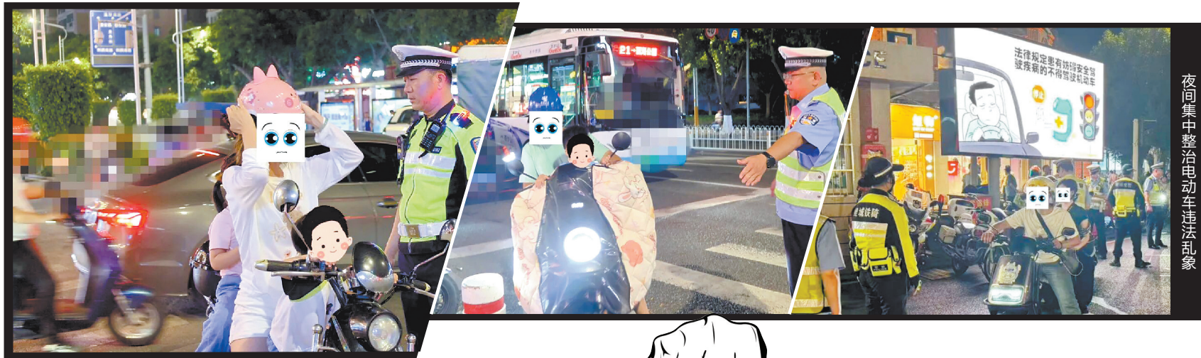
夜间集中整治电动车违法乱象

早报讯(融媒体记者傅恒 通讯员赵美缘 文/图)为深入推进电动自行车骑乘未戴安全头盔专项整治及电动自行车交通安全管理“提升行动”,规范城区道路交通秩序,消除道路交通安全隐患,连日来,泉州公安交警统一部署,组织鲤城、丰泽交警在中心市区开展电动自行车重点违法夜间专项整治行动,持续以严管高压态势净化路面通行环境,筑牢辖区道路交通安全防线。