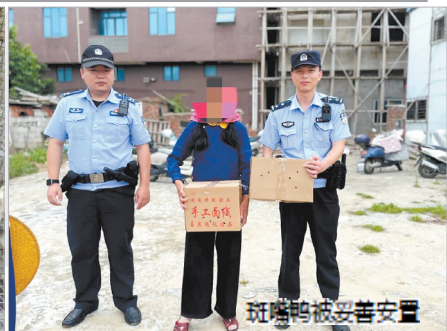
斑嘴鸭被妥善安置