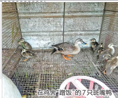
在鸡舍“蹭饭”的7只斑嘴鸭