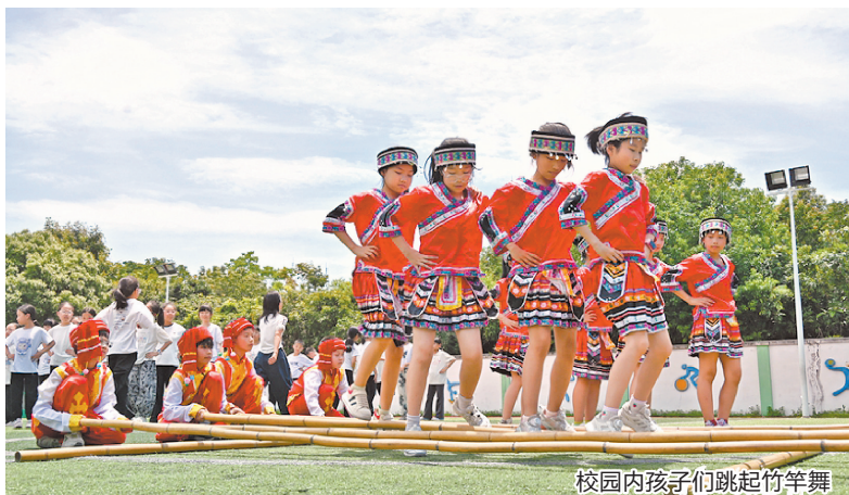
校园内孩子们跳起竹竿舞