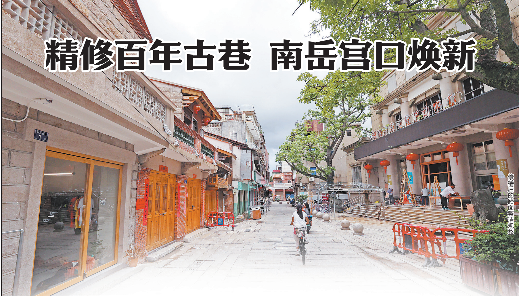
修缮后的路面整治规范