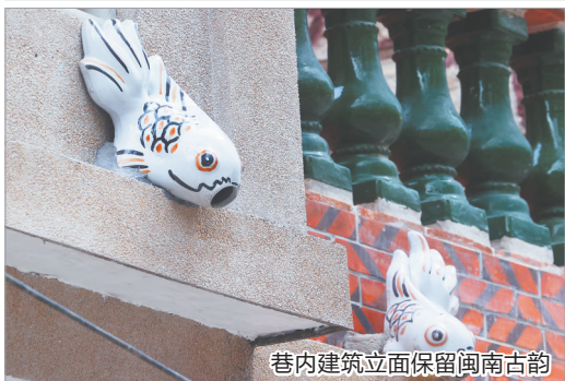
巷内建筑立面保留闽南古韵

早报讯 (融媒体记者张素萍 王柏峰 通讯员刘柏涵 王怡莹 文/图)近日,泉州古城城南片区百年古巷南岳宫口完成精细化提升改造。此次工程兼顾历史风貌保护与民生设施升级需求,通过路面修缮、管网改造、建筑整饰、配套提质等一系列举措,让这条承载闽南民俗文脉与老城烟火气的古巷古韵长存、功能升级。