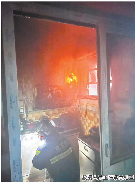
救援人员正在紧急处置