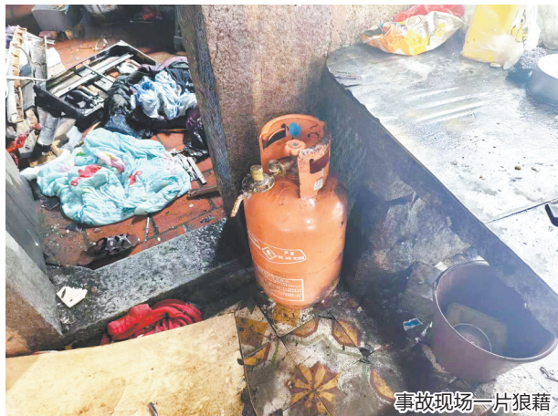
事故现场一片狼藉