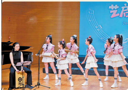
▲演唱间,孩子们用拍手、拍腿、跺脚等声势动作来模拟大雨、小雨、雷声等自然声响。