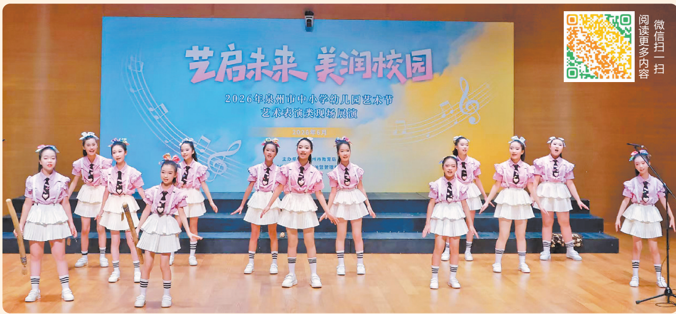
▲合唱团的孩子们声情并茂演唱《周末时光》