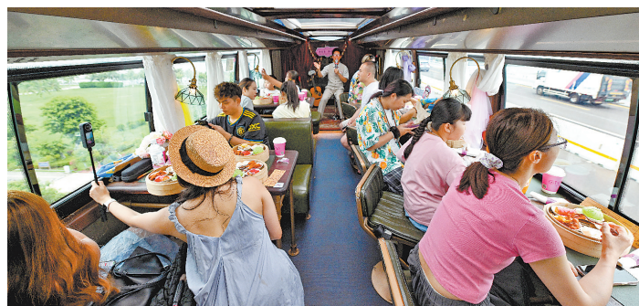
昨日,游客在老爸茶海口巴士上品尝茶点。

据了解,中国公民去佛得角可以办理落地签,停留期30天,旅客出发前必须完成在线预登记,以及在官网完成EASE(佛得角政府推出的官方入境登记平台)入境登记和健康申报,并支付相关费用。(中新 北晚)