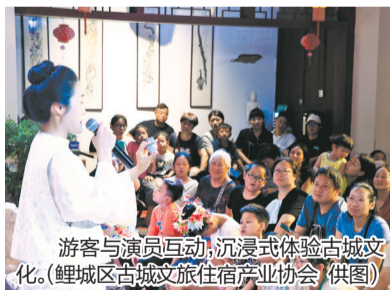
游客与演员互动,沉浸式体验古城文化。

如何更好地挖掘演唱会带来的流量经济?在业界看来,演唱会是城市吸引流动人群的窗口,利用窗口向消费者展现服务能力,提升城市形象,输出城市文旅招牌,才能产生“回头客”,纵深提高城市文化影响力。尤其在自