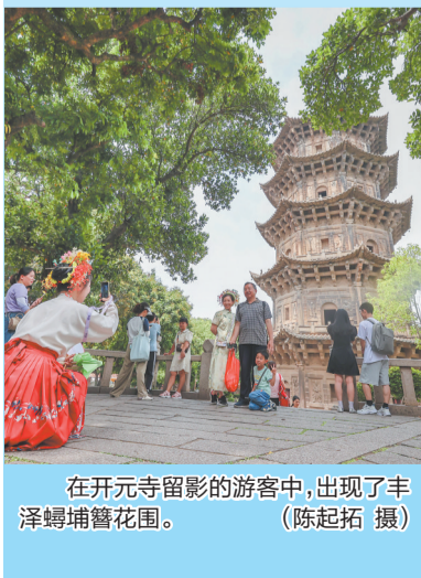
在开元寺留影的游客中,出现了丰泽蟳埔簪花围。

如今,演唱会不再是“一锤子买卖”,不少演唱会观众选择“提前来、晚点走”,深度感知演唱会所在城市。面对这一文旅新趋势,泉州通过推出景区优惠活动、优化城市配套等方式,留住观众群体,邀他们沉浸式感受世遗泉州的魅力。