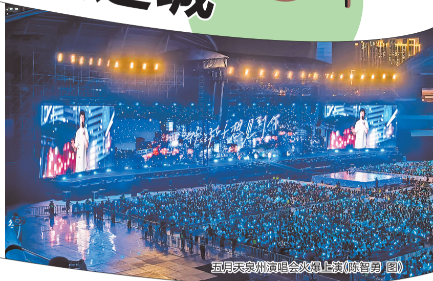
五月天泉州演唱会火爆上演