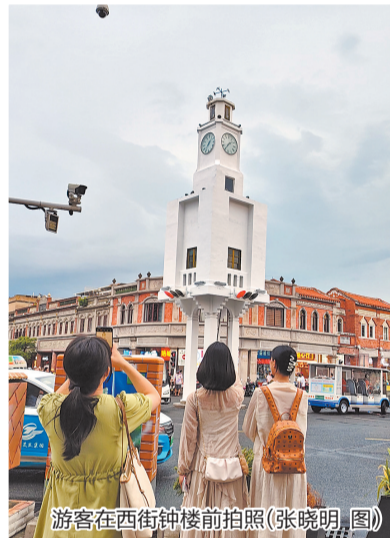
游客在西街钟楼前拍照

此前在西安举办的TFBOYS十周年演唱会,根据第三方抽样调查统计,演出前后,西安出行总订单量同比增长738%,门票收入3576万元,直接带动4.16亿元的旅游收入。另据海口文旅数据显示,周杰伦4场演唱会共吸引观众15.46万人次入场,其中省外观众9.51万人次,占观众总数的61.5%。海口全市4天共实现旅游收