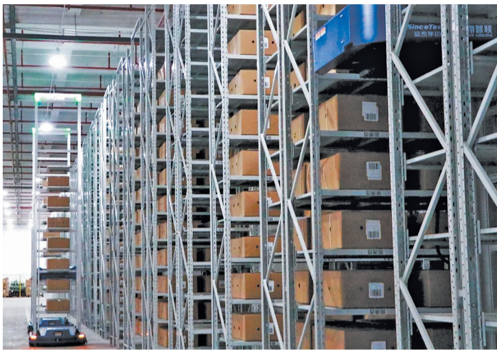
信泰集团飞织仓通过数字化转型提升企业的可持续发展能力 (资料图片)

恒安国际集团亦在近日举行的香港“ESG认证嘉许暨永续发展论坛2024”活动中,凭借在环境、社会及企业管治(ESG)领域的