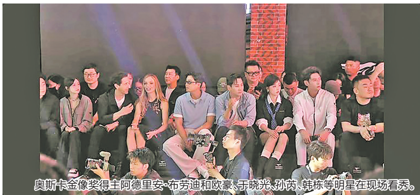
奥斯卡金像奖得主阿德里安·布劳迪和欧豪、于晓光、孙芮、韩栋等明星在现场看秀。