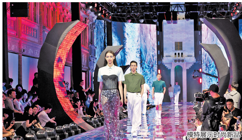
模特展示时尚新品