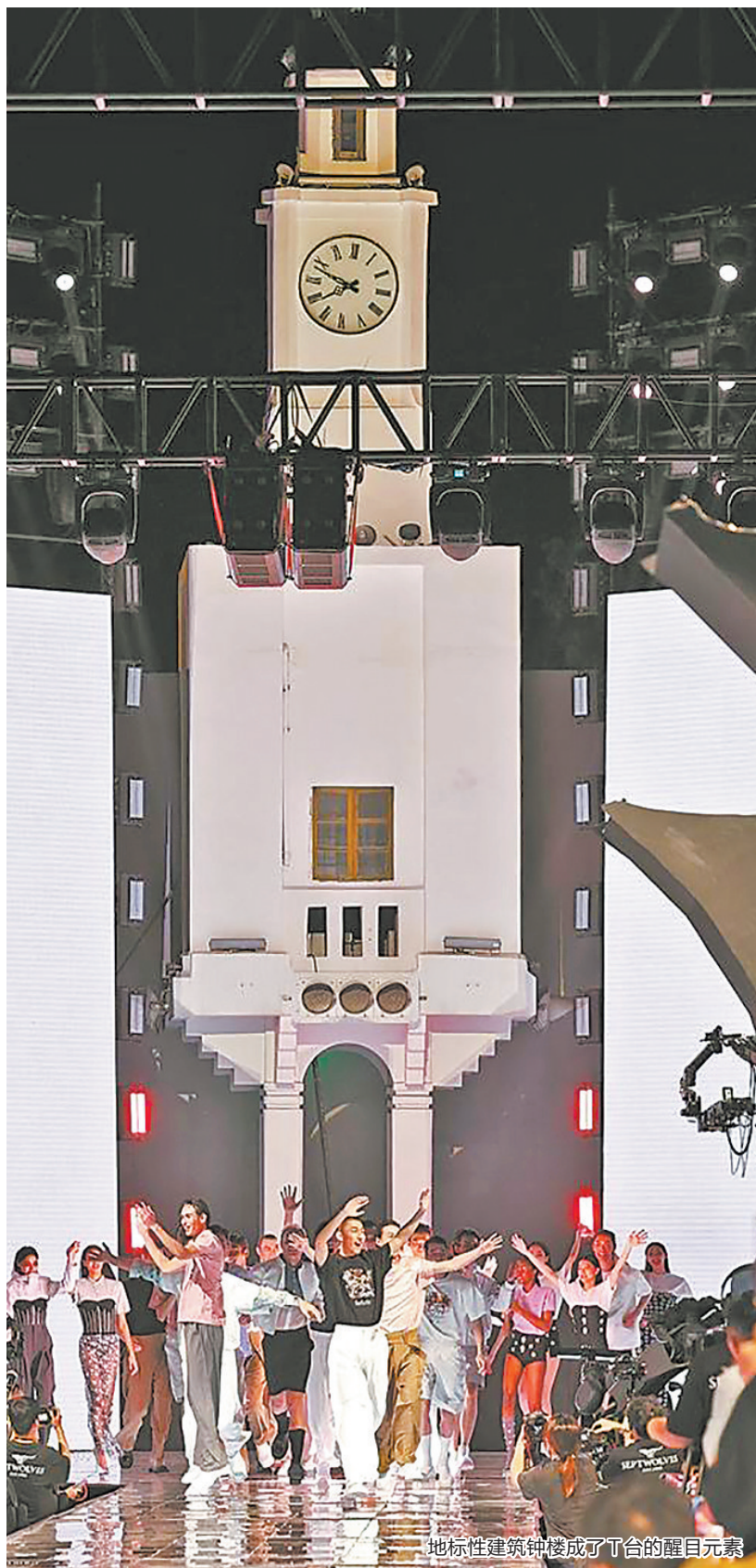
地标性建筑钟楼成了T台的醒目元素

近日,“世遗泉州 时尚之都”——2025泉州时尚周系列活动举行。17日晚上,时尚周首发大秀在泉州中山路钟楼精彩上演。首发大秀通过联动国际时尚资源,数字化“焕肤”百年骑楼建筑群,让泉州千年世遗文脉与现代时尚美学在骑楼街区激情碰撞。两届奥斯卡金像奖得主阿德里安·布劳迪和欧豪、孙芮、韩栋、于晓光等明星亮相秀场。