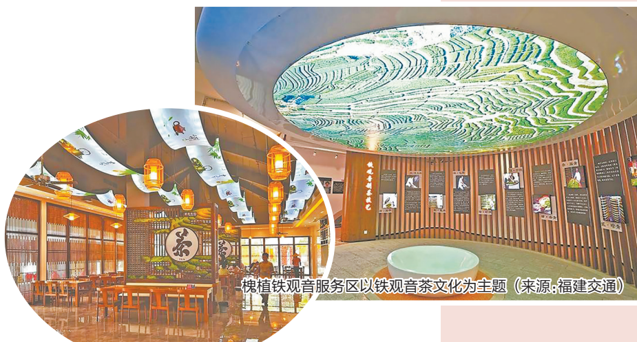
槐植铁观音服务区以铁观音茶文化为主题 (来源:福建交通)