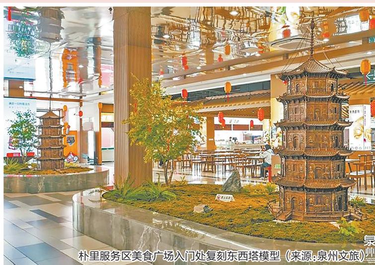
朴里服务区美食广场入口处复刻东西塔模型