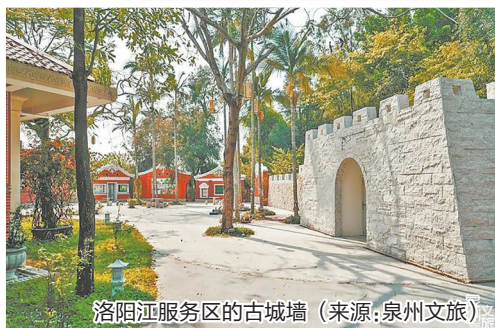
洛阳江服务区的古城墙