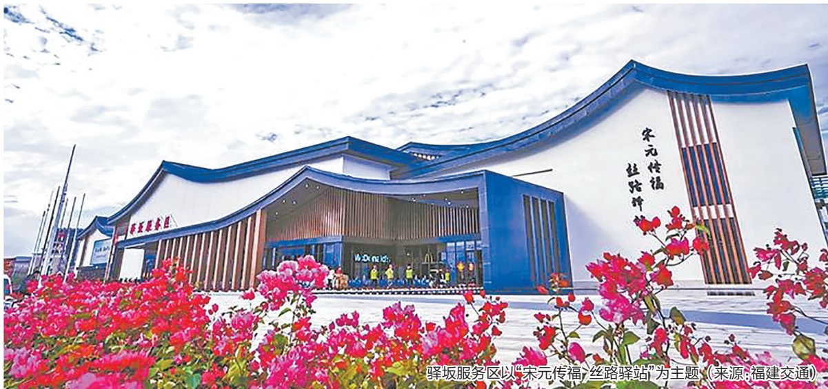
驿坂服务区以“宋元传福 丝路驿站”为主题