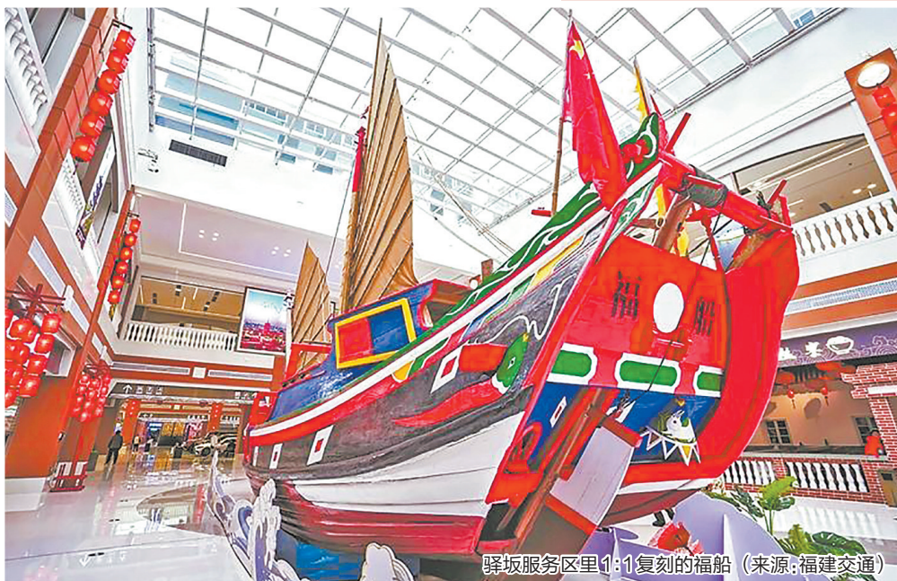
驿坂服务区里1:1复刻的福船