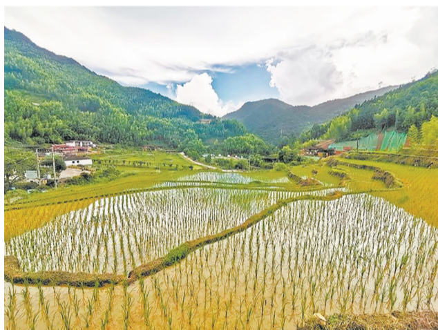
800亩梯田和葱茏青山融为一体

梯田之外是另一种诗意。央媒的镜头下,梯田的曲线,既有农耕文明的厚重,又有向新而生的活力。(陈小芬)