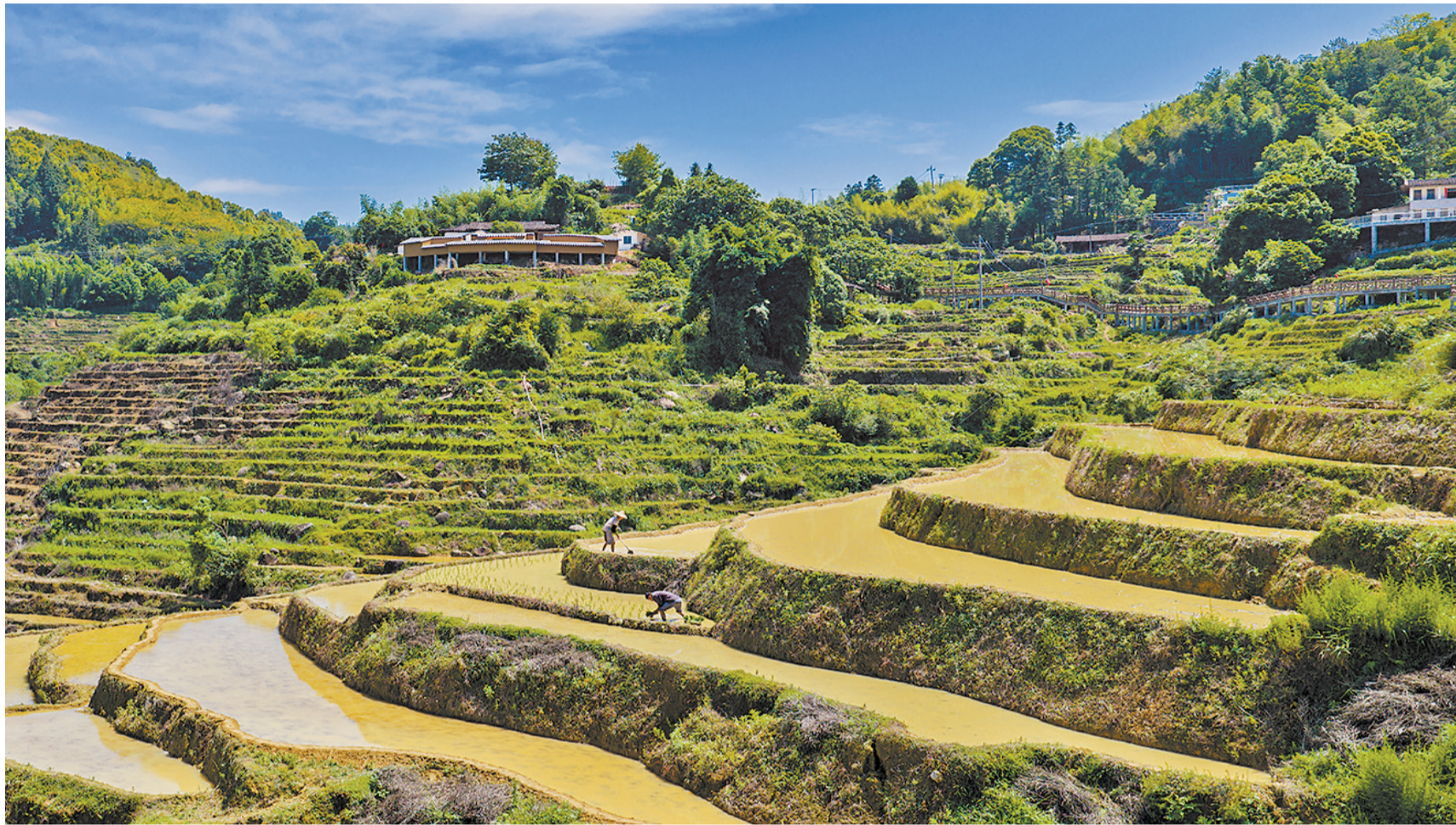
依山而筑的梯田

夏日熏风轻柔拂过大地,德化李溪村800余亩的梯田正以最动人的姿态向世人展示着农耕文明的隽永之美。日前,中央广播电视总台以《云端梯田叠金波 犁影晨雾织诗行》为题,将镜头对准这片镶嵌在戴云山脉间的“大地指纹”。