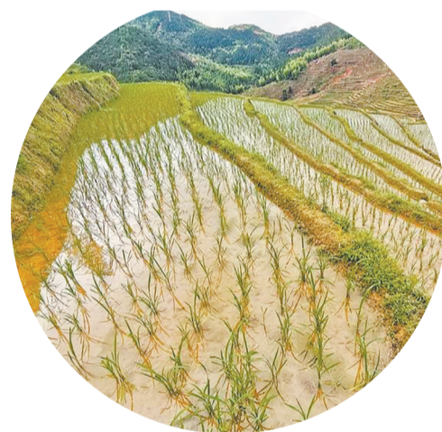
春种秋收,循环不息。