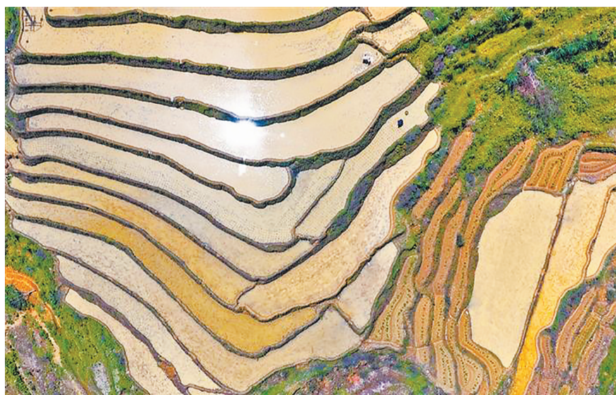
蜿蜒的田埂勾勒出自然的几何美学