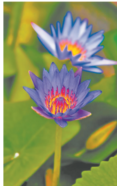
睡莲或蓝或紫,娇小玲珑,绽放于水波之上,别有一番含蓄内敛之美。