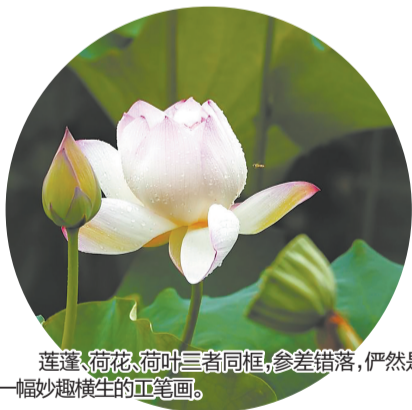
莲蓬、荷花、荷叶三者同框,参差错落,俨然是一幅妙趣横生的工笔画。

东湖的荷韵,不仅在于自然之美,更浸润着千年文脉。1991年,东湖辟为“东湖公园”,以中心湖水体为核心,环湖建了人文主景——“星湖荷香”(中轴线)、“祈风阁”(至高点),并建“二公亭”“东湖亭”等景观,静默诉说着千年往事,让游客在赏荷的同时,也能感受历史的厚重与文化的传承。