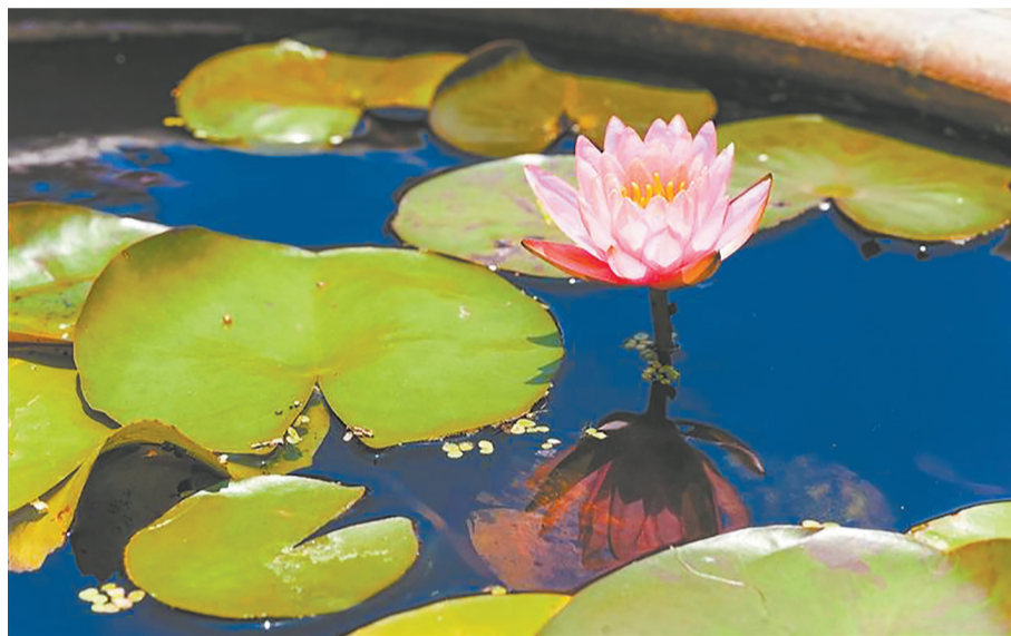
承天寺睡莲虽生于方寸之器,却显得格外玲珑可爱,充满生机与意趣。

盛夏的泉州,诗意在舒展的荷瓣上悄然流淌。东湖公园“星湖荷香”沉淀着千年雅韵,笋江园“莫奈花园”成为新晋打卡地。泉州的荷韵,早已超越了粉白相间的视觉盛宴。它们晕染成湖光水色间的灵动丹青,沉淀为亭台碑记里的厚重文脉,更弥漫作穿越时空、浸润古城肌理的缕缕幽香,向你我发出跨越千年的诗意邀约。