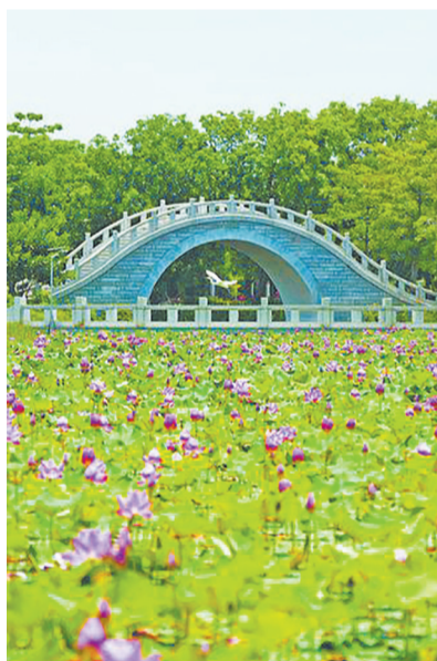
笋江园白鹭和花相映成趣