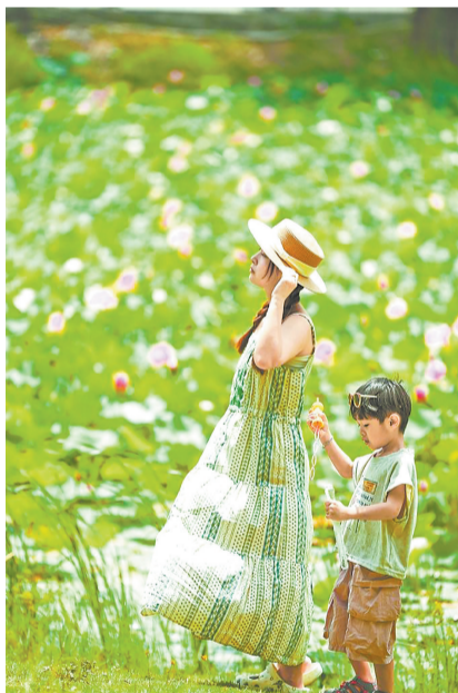
粉红与青绿层叠交错,仿佛置身莫奈的花园。

提及笋江,许多泉州人的第一反应是扒龙船习俗,赛龙舟是扒龙船的一个重要环节。明清时期,泉州舟人竞渡成为盛大节日活动。