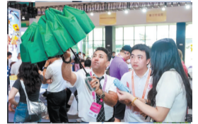
A/08版 晋江伞业构筑 全球供应链条