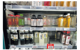
B/17版 药食同源 茶饮赛道扩容