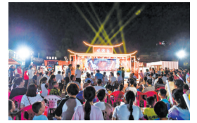
A/07版 暑期文旅盛宴来袭