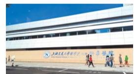
C/24版 未来“元宇宙”医院 长啥样