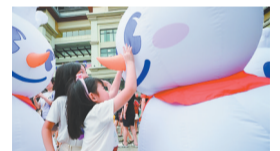
C/20版 新消费的“河南现象”