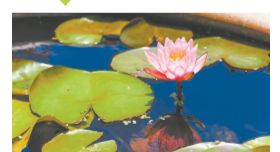
D/27版 莲影摇曳 千年诗意