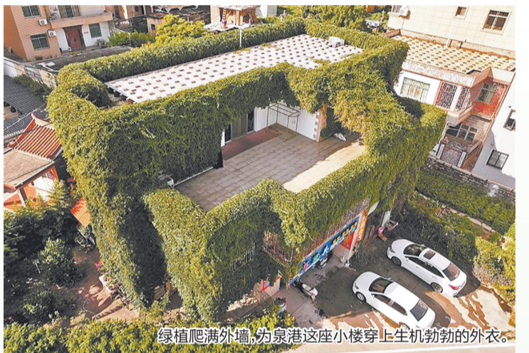
绿植爬满外墙,为泉港这座小楼穿上生机勃勃的外衣。