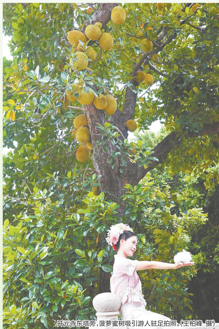
开元寺东塔旁,菠萝蜜树吸引游人驻足拍照。