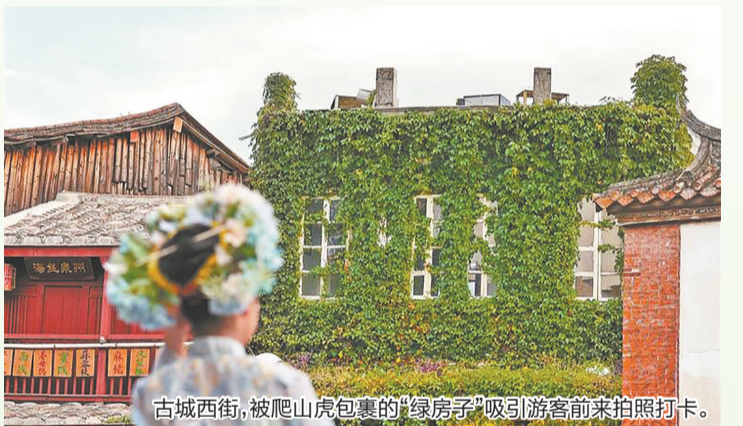
古城西街,被爬山虎包裹的“绿房子”吸引游客前来拍照打卡。