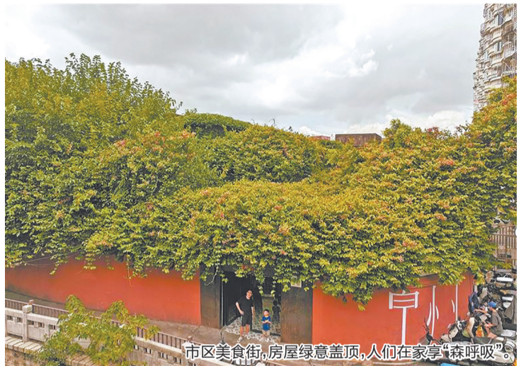
市区美食街,房屋绿意盖顶,人们在家享“森呼吸”。