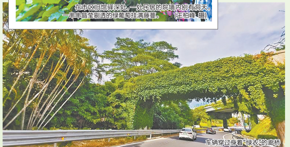
车辆穿过身着“绿衣”的廊桥