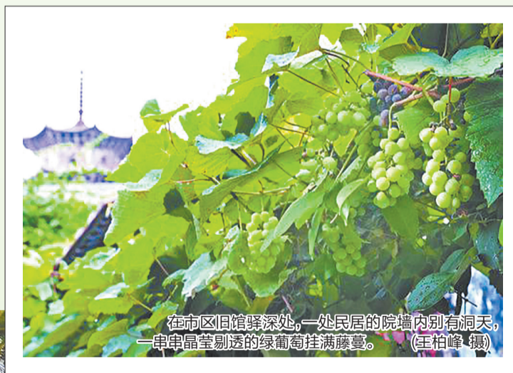
在市区旧馆驿深处,一处民居的院墙内别有洞天,一串串晶莹剔透的绿葡萄挂满藤蔓。