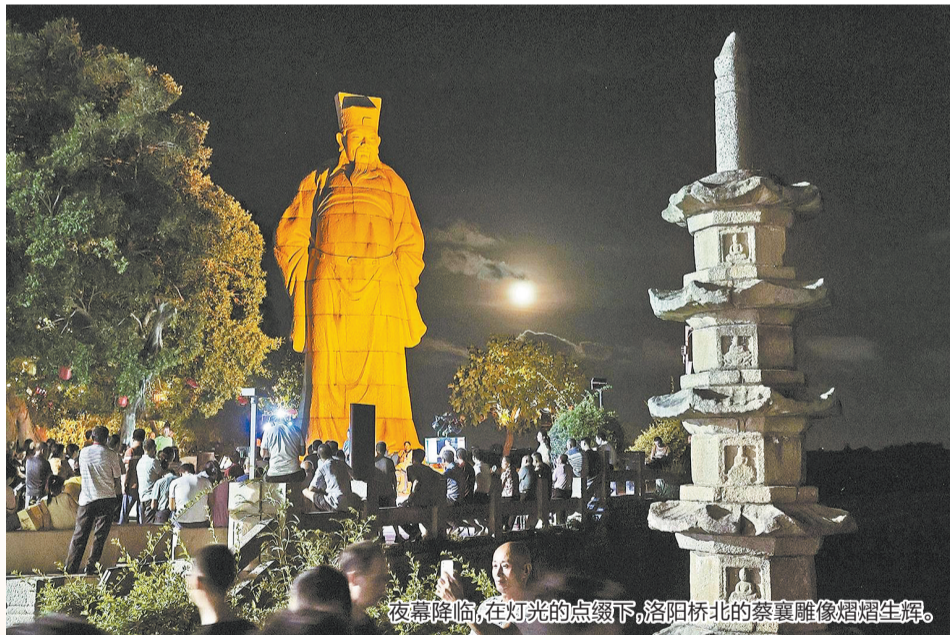
夜幕降临,在灯光的点缀下,洛阳桥北的蔡襄雕像熠熠生辉。