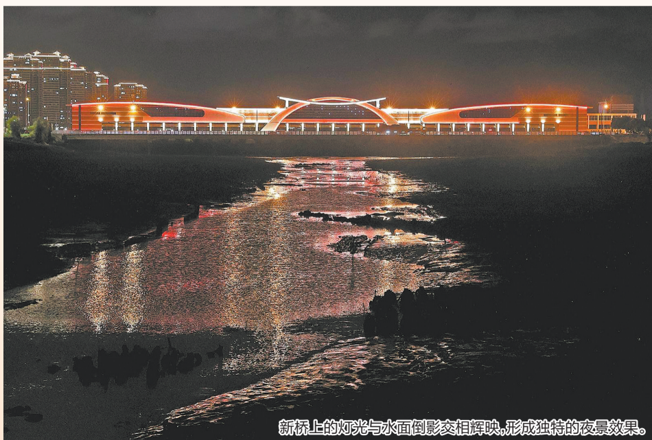
新桥上的灯光与水面倒影交相辉映,形成独特的夜景效果。