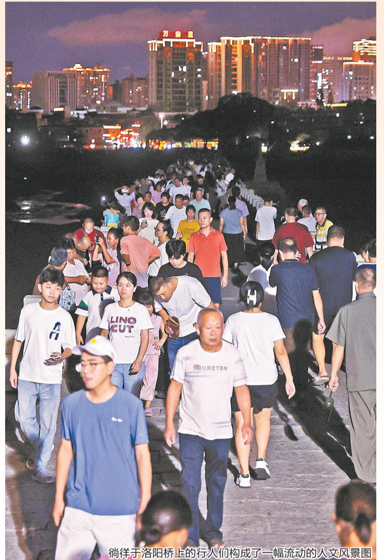
徜徉于洛阳桥上的行人们构成了一幅流动的人文风景图