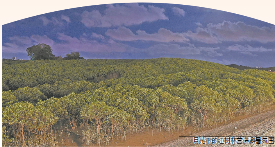
月光下的红树林静谧与安宁