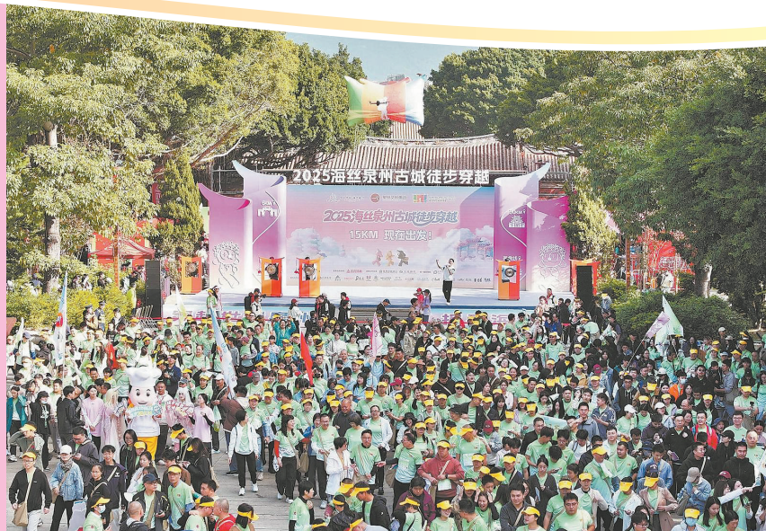
古城徒步参与者从泉州府文庙广场出发