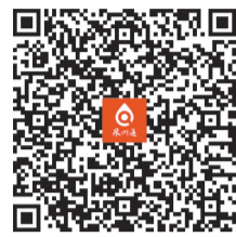
扫码查看更多内容

景区景点、旅行社和游客集中的场所,开展明察暗访,推动文明旅游和志愿服务工作的各项要求落实到基层。“五一”前后,各县(市、区)文明办要组织对旅游单位的文明旅游宣传引导和志愿服务工作情况进行检查。