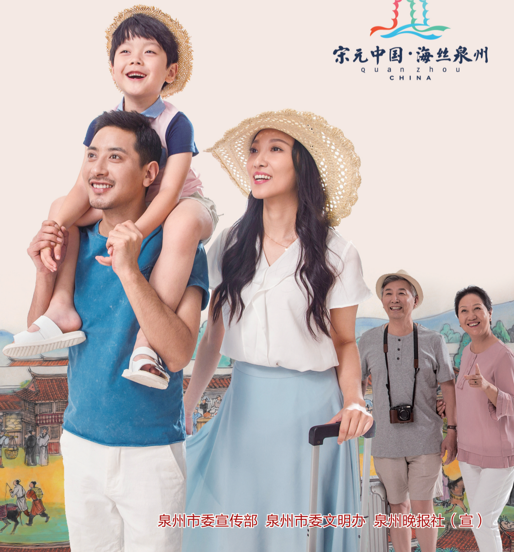
泉州市委宣传部 泉州市委文明办 泉州晚报社(宣)