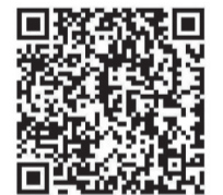
古城美食电子地图

此外,广大游客和市民若遇到酒店、餐饮店等商家未予标明或模糊标价情况时,要仔细询问清楚具体的价格后,再做出决定;消费前应该对好价格,确认后再选择消费;用餐后仔细核对账单,再进行付款。消费者应索要消费凭证并予以保留,当遇到商家不诚信经营,可拨打12315进行投诉。