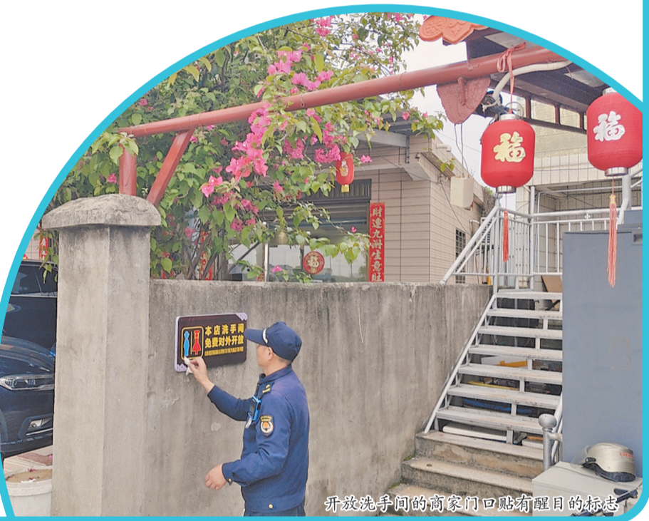
开放洗手间的商家门口贴有醒目的标志

本报讯(记者王金植 通讯员吴建南文/图)劝导沿街商家对外开放厕所,设置3处移动厕所,开放2处停车场并新增一处……据丰泽区预测,“五一”假期每天将有近万名游客到蟳埔社区游玩。连日来,丰泽区城市管理局和东海街道采取多项举措应对旅游高峰。