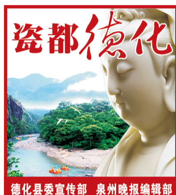
德化县委宣传部 泉州晚报编辑部