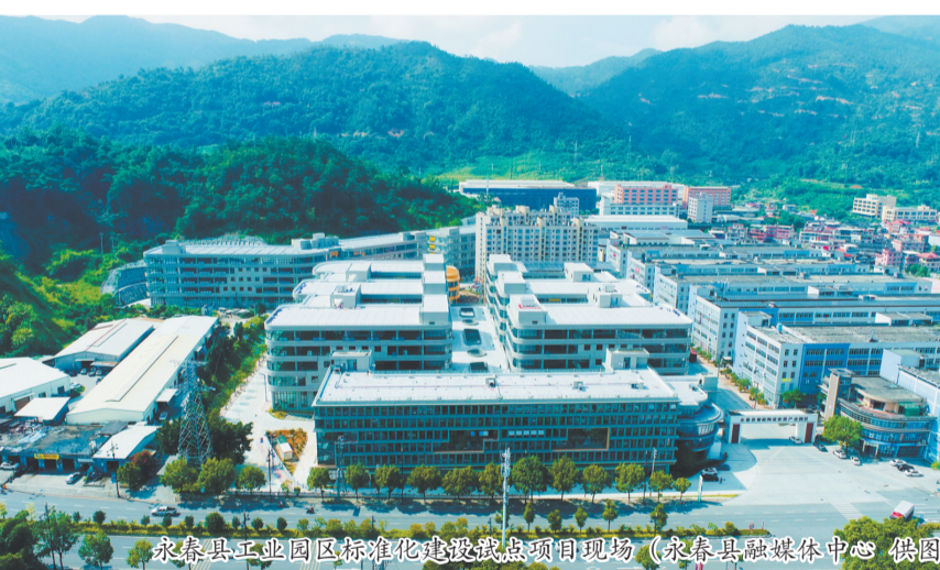
永春县工业园区标准化建设试点项目现场

永春县工业园区标准化建设试点项目位于桃城镇南星片区。项目按照“产城融合”理念和“集约利用”原则,打造集众