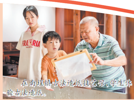
在南埕镇古法造纸技艺体验馆,师生体验古法造纸。

随着“大城关”发展战略的深入实施,德化县大量农村群众进城,常住人口城镇化率达78.6%,农村空心化、老龄化日益严重,城乡公共服务体系发展不平衡。为此,德化县立足自身实际,在城区核心区域依托进城党群城市家园,成立16个新时代文明实践城关志愿服务站,为群众提供物品寄送、农特产品销售、探亲顺风车、资源信息共享等爱心服务,常态化开展文明实践活动,在城区、农村“两端”搭建文明实践便民服务平台。