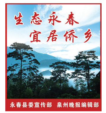
生态永春 宜居侨乡 永春县委宣传部 泉州晚报编辑部

近年来,永春县立足本地资源优势,促进种植业结构调整,大力发展特色果蔬产业,探索多元产业,并出台了奖补办法,支持种植大户发展规模经营,进一步带动农业增效、农民增收。图为坑仔口镇的黄花菜(图①)和吾峰镇的特早蜜橘(图②)喜获丰收。