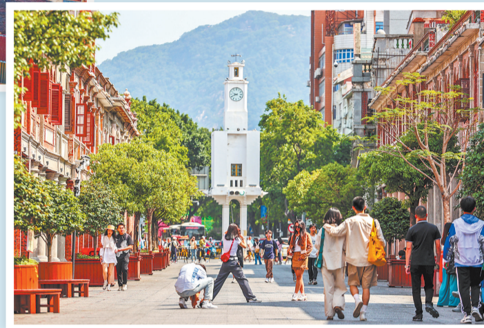
许多游客在观看演唱会后打卡泉州