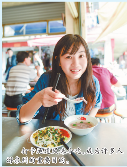
打卡地道风味小吃,成为许多人游泉州的重要目的