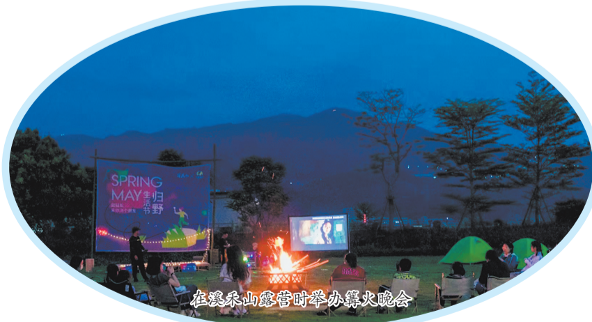
在溪禾山露营时举办篝火晚会

志闽森林营地坐落于安溪龙门镇志闽生态旅游区。景区集餐饮住宿、商务会议、休闲娱乐、旅游度假为一体,各种配套设施齐备,娱乐项目丰富多样,建筑风