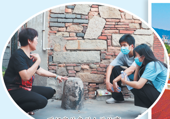
听好客的泉州人讲故事