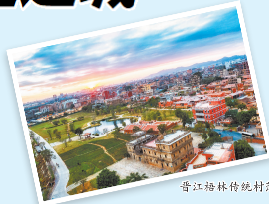
晋江梧林传统村落