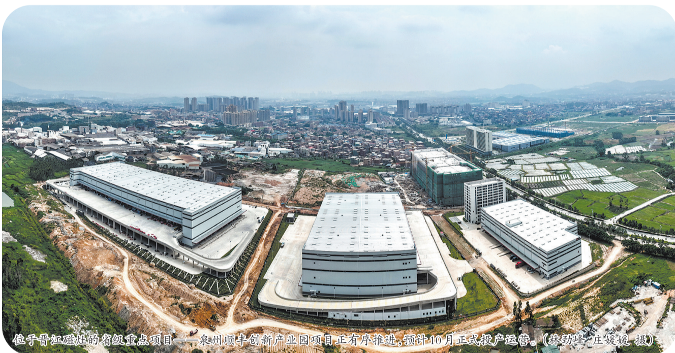
位于晋江磁灶的省级重点项目——泉州顺丰创新产业园项目正有序推进,预计10月正式投产运营。

抓城建提品质方面,本次开竣工活动共安排基础设施、城市建设项目12个,总投资48.4亿元,涵盖综合交通、城市管理、和美乡村等重点建设提升领域。其中,晋江晋南片区城乡供水一体化工程依托水务集团推动供水资源整合,配套开展市政输水管网、村居自来水一户