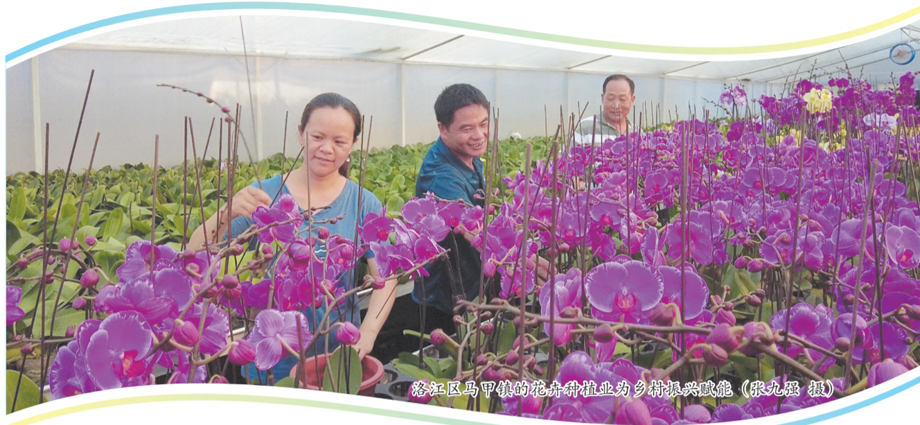
洛江区马甲镇的花卉种植业为乡村振兴赋能。

今年,市政协把“促进泉州花卉苗木产业高质量发展”作为对口协商议题,形成了一份质量较高的调研报告。报告显示,花卉苗木产业是朝阳产业,是当今世界上发展最快且稳定增长的产业之一。当前,泉州花卉苗木产业已初具规模,从经营规模看,花卉苗木种植面积12.38万亩,涌现一批销售额上千万的花卉龙头企业,拥有69家省、市级花卉生产示范基地。从产品结构看,生产经营种类众多。从经营范围看,已从一开始的单一绿化苗木栽培销售,逐步向盆花生产、园林绿化、休闲旅游、展览展示、花卉租