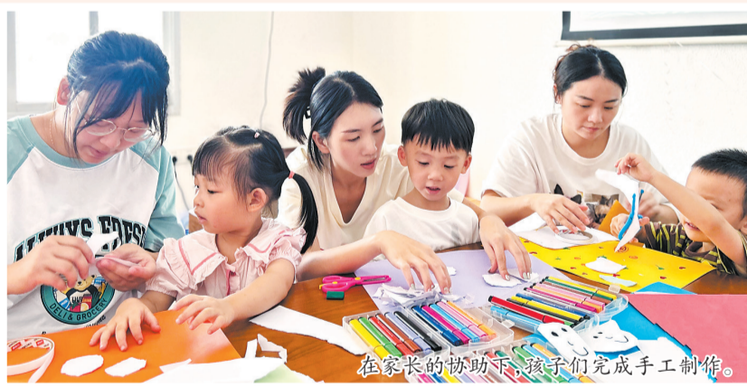
在家长的协助下,孩子们完成手工制作。

本报讯(记者罗剑生 通讯员郑思滢文/图)近日,泉州台商投资区教育文体旅游局党委联合东园镇党委、龙苍社区党支部及区第一幼儿园党支部,共同举办“早教进社区 相儒邻里情”活动。