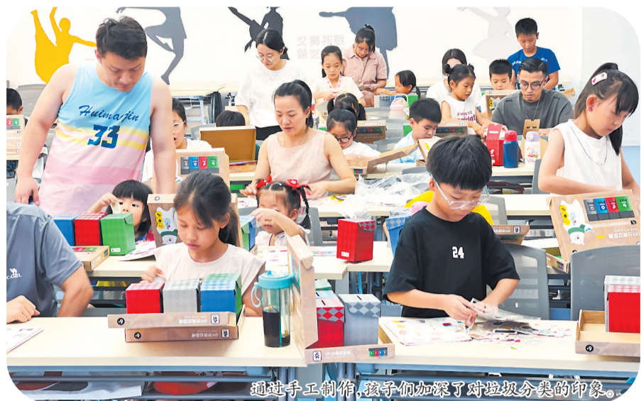
通过手工制作,孩子们加深了对垃圾分类的印象。