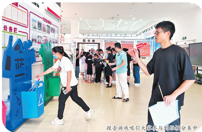
投篮游戏吸引大家参与到垃圾分类中

本报讯(记者罗剑生 通讯员郑思滢文/图)近日,由泉州台商投资区党工委、区教育文体旅游局主办,区文化服务中心承办的“节能减碳 你我同行”垃圾分类宣传活动开展,进一步推进垃圾分类,倡导低碳环保的生活理念,营造节能降碳的浓厚氛围。