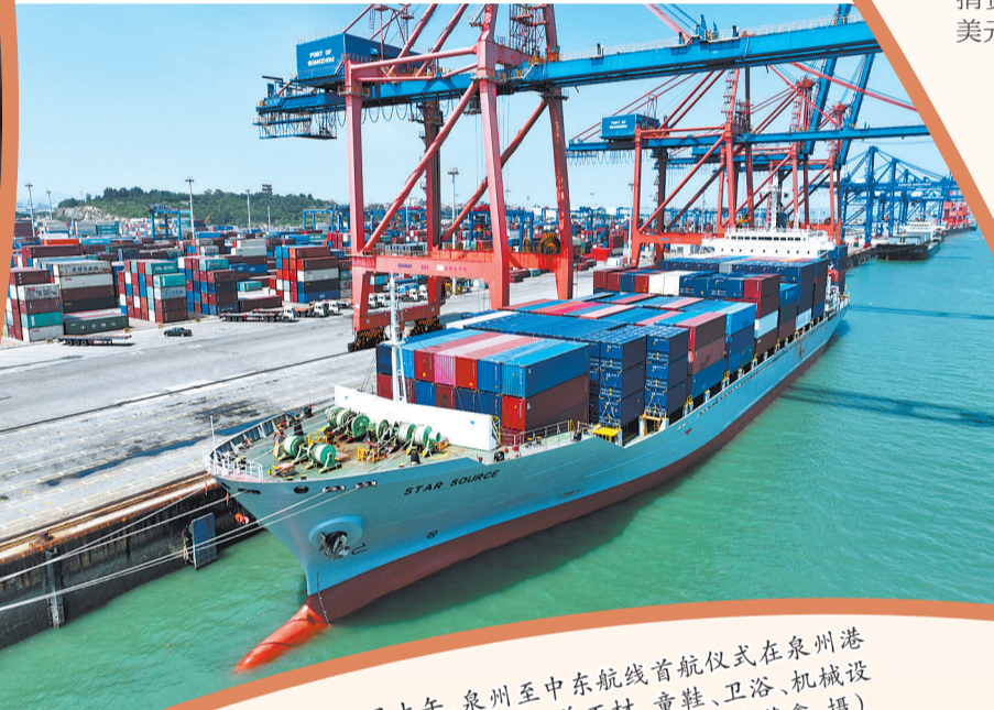
▲2023年5月25日上午,泉州至中东航线首航仪式在泉州港石狮石湖作业区举行。“星源”轮装载着石材、童鞋、卫浴、机械设备等泉州货物,等待启航前往中东迪拜杰贝阿里港。