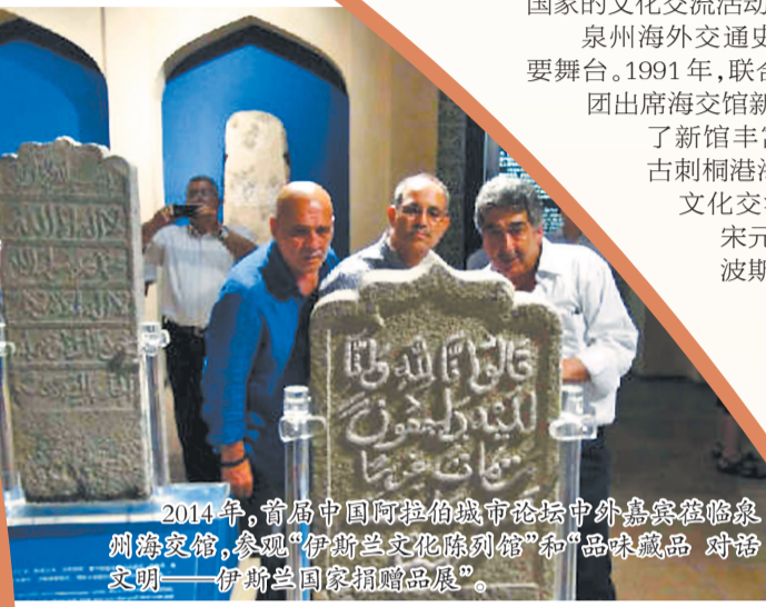
2014年,首届中国阿拉伯城市论坛中外嘉宾莅临泉州海交馆,参观“伊斯兰文化陈列馆”和“品味藏品”对话文明——伊斯兰国家捐赠品展。