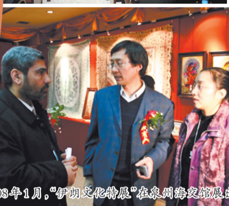
2008年1月,“伊朗文化特展”在泉州海交馆展出。