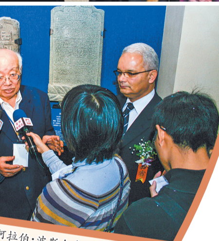
2008年11月,泉州海交馆“阿拉伯·波斯人在泉州”专题陈列对外开放。参观陈列馆过程中,埃及驻华大使马哈茂德发现了他们哈通家族的先人墓碑石刻。