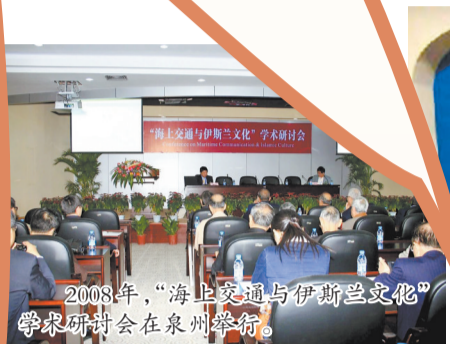
2008年,“海上交通与伊斯兰文化”学术研讨会在泉州举行。

金砖国家扩员引发广泛关注。事实上,金砖大家庭多位新成员,与泉州已是千年“老朋友”。回望历史,泉州与沙特、埃及、伊朗等中东国家的友好往来历史悠久,唐代伊斯兰教传入泉州,其时,沿着“海上丝绸之路”而来的阿拉伯、波斯(伊朗的前身)商人已为数不少,到了宋元时期,这个被称为“刺桐”的东方大港,更成了他们在远东最大的商业枢纽和聚居地。传承友谊、面向未来,泉州与中东国家续写“海丝情缘”,在文化交流、经贸往来等方面,谱写“金砖合作”新篇章。