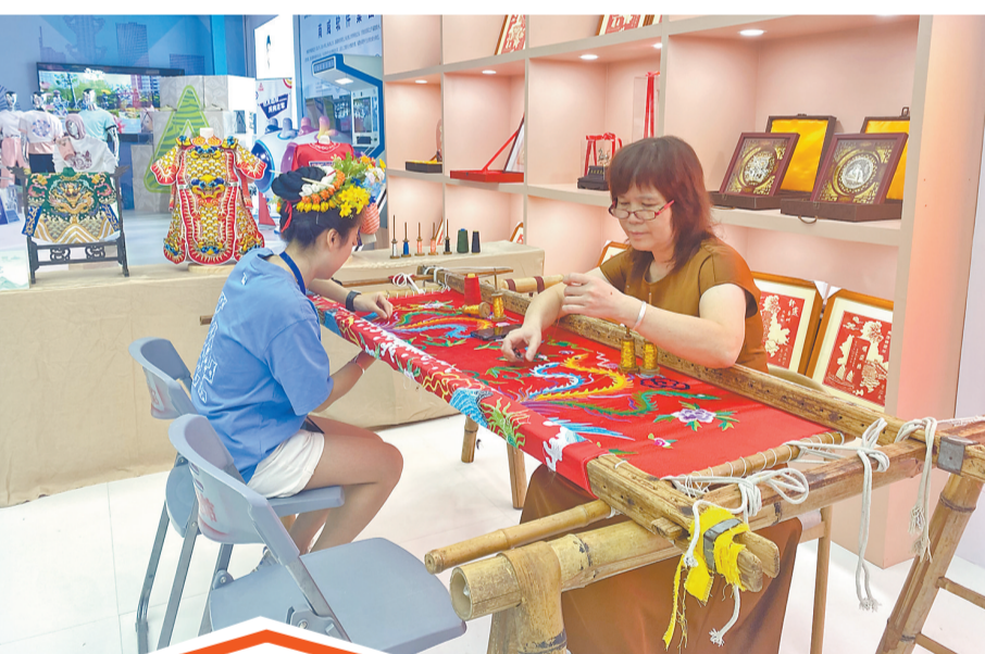
泉州金苍绣技艺展示

本次“一县一馆”集结了12个县(市、区)80多项非遗项目,其中包含泉州花灯、德化瓷烧制、永春香、蟳埔女习俗等13个国家级非遗项目。在泉州优品综合展示区,以“世遗之城、国潮之城、烟火之城”为布展主题,集中展示泉州各县(市、区)最具代表性的优品名品特色。各县(市、区)特色馆力邀各地方知名品牌、名优特产品、文化品牌、非遗工艺入驻展示。值得一提的是,在展馆互动体验区,24位非遗传承人现场进行非遗手工艺展示,嘉宾和游客参观时零距离观看非遗技艺,与非遗传承人探讨非遗相关知识,共享泉州的非遗之美。