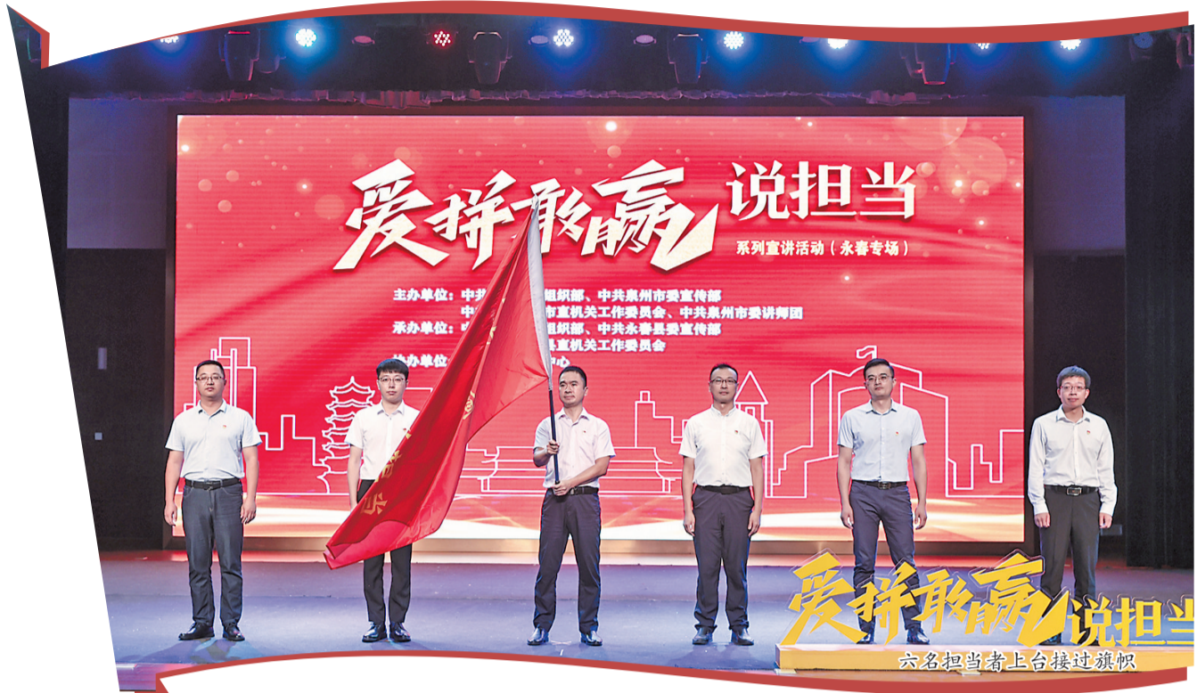
六名担当者上台接过旗帜