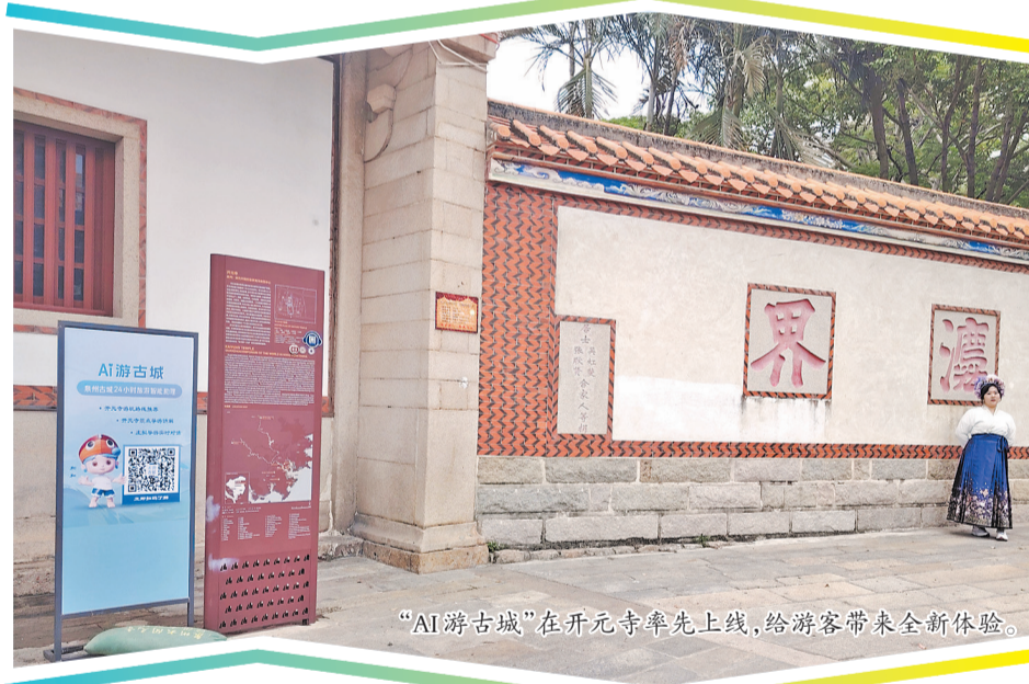
“AI游古城”在开元寺率先上线,给游客带来全新体验。

智慧语音讲解平台结合观众线下使用场景,语气轻松自然,有现场感,给观众营造一种现场陪伴式的讲述感。陪伴式讲述结合线下使用场景,每个遗产点拆分成多个小主题,便于大家根据主题多次重复听讲。