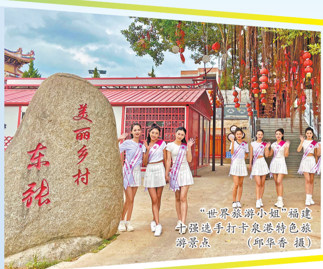
“世界旅游小姐”福建 七强选手打卡泉港特色旅 游景点