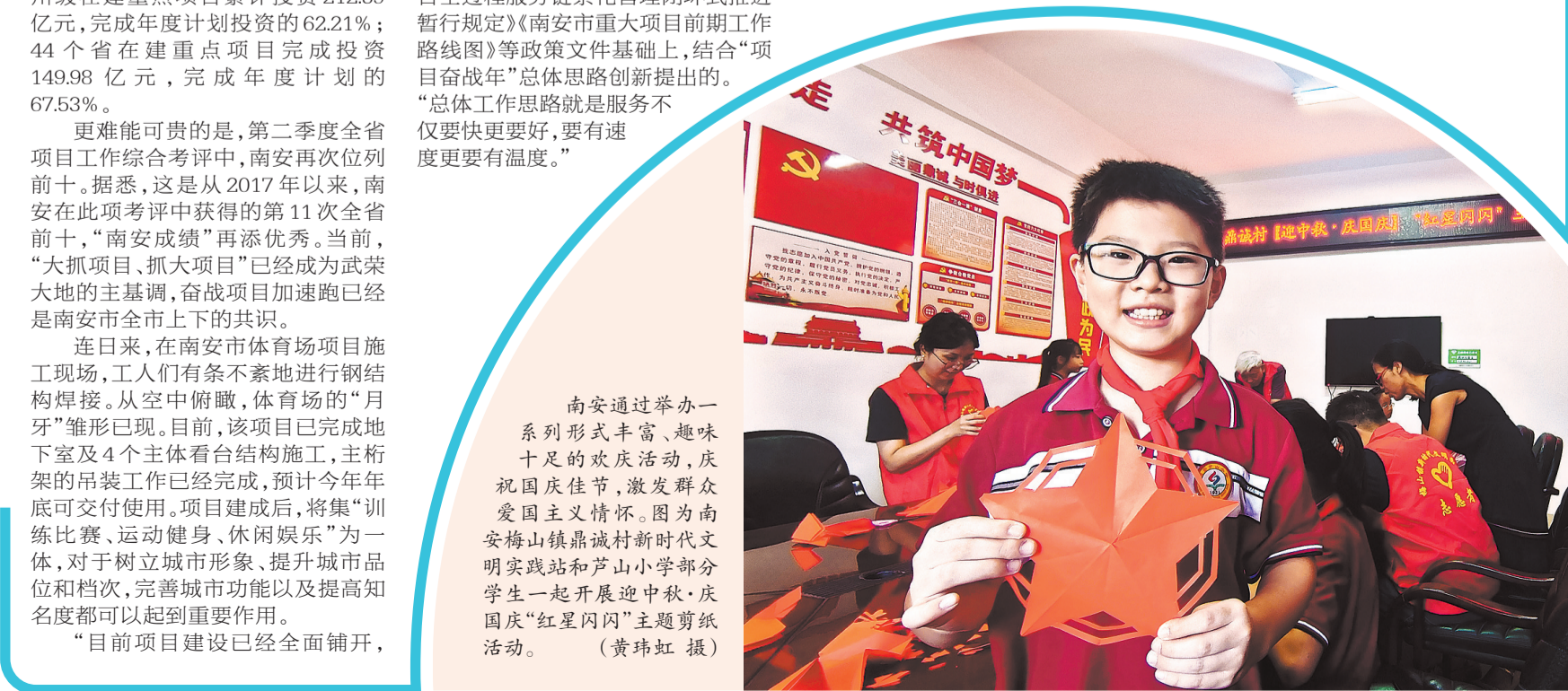
南安通过举办一系列形式丰富、趣味十足的欢庆活动,庆祝国庆佳节,激发群众爱国主义情怀。图为南安梅山镇鼎新村新时代文明实践站和芦山小学部分学生一起开展迎中秋、庆国庆“红星闪闪”主题剪纸活动。

据介绍,南安现有省工艺美术大师8名、省工艺美术名人16名、泉州市工艺美术大师22名、南安市工艺美术大师31名;组织参评参展,近四年共取得金奖25个、银奖41个、铜奖50个的佳绩;自2017年以来,先后推荐65人参加泉州各地区的工艺美术高级研修班;推荐16人参加省市非遗培训班;组织工艺美术人才参加工艺美术(高级、中级、初级)职称评审,共有4人获评高级职称、6人获评中级职称、5人获评初级职称。(陈瑞萍 蔡丹凤)