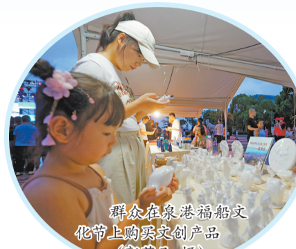
群众在泉港福船文 化节上购买文创产品

9月28日,福厦高铁正式开通,揭开了泉港融入厦漳“1小时生活圈”的序幕。今年中秋、国庆“双节”假期被称为“最火黄金周”,该区以高铁泉港站开通运营为契机,抢抓“高铁+文旅”新机遇,备足文旅大餐,围绕2023年“灯耀泉港”金秋文旅商融合季,举办“从心启航·长寿泉港”2023年“中国长寿之乡”泉港文旅嘉年华等系列活动,喜迎八方宾朋,掀起新一轮文旅热潮,助推经济高质量发展。