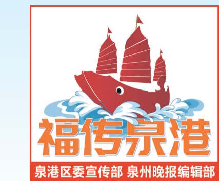
泉州区委宣传部 泉州晚报编辑部