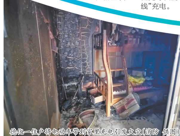
德化一住户将电动车带到家里充电引发火灾

近日,市消安委办抽调市教育、公安、住建、卫健、消防等业务骨干组成暗访督导组,深入各县(市、区)开展“三合一”、群租房暗访督导。检查发现,各地“三合一”新增或回潮现象严重,电气线路裸露老化、私拉乱接,电动自行车违规在室内、楼梯间停放充电等隐患问题突出。市消安委办根据实地暗访督导情况分别制作《各地“三合一”暗访曝光警示片》,点对点向各县(市、区)下发专项督导通报6份,逐家落实隐患整改责任“三张清单”。