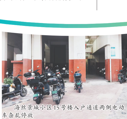
海丝景城小区15号楼入户通道两侧电动车乱停放