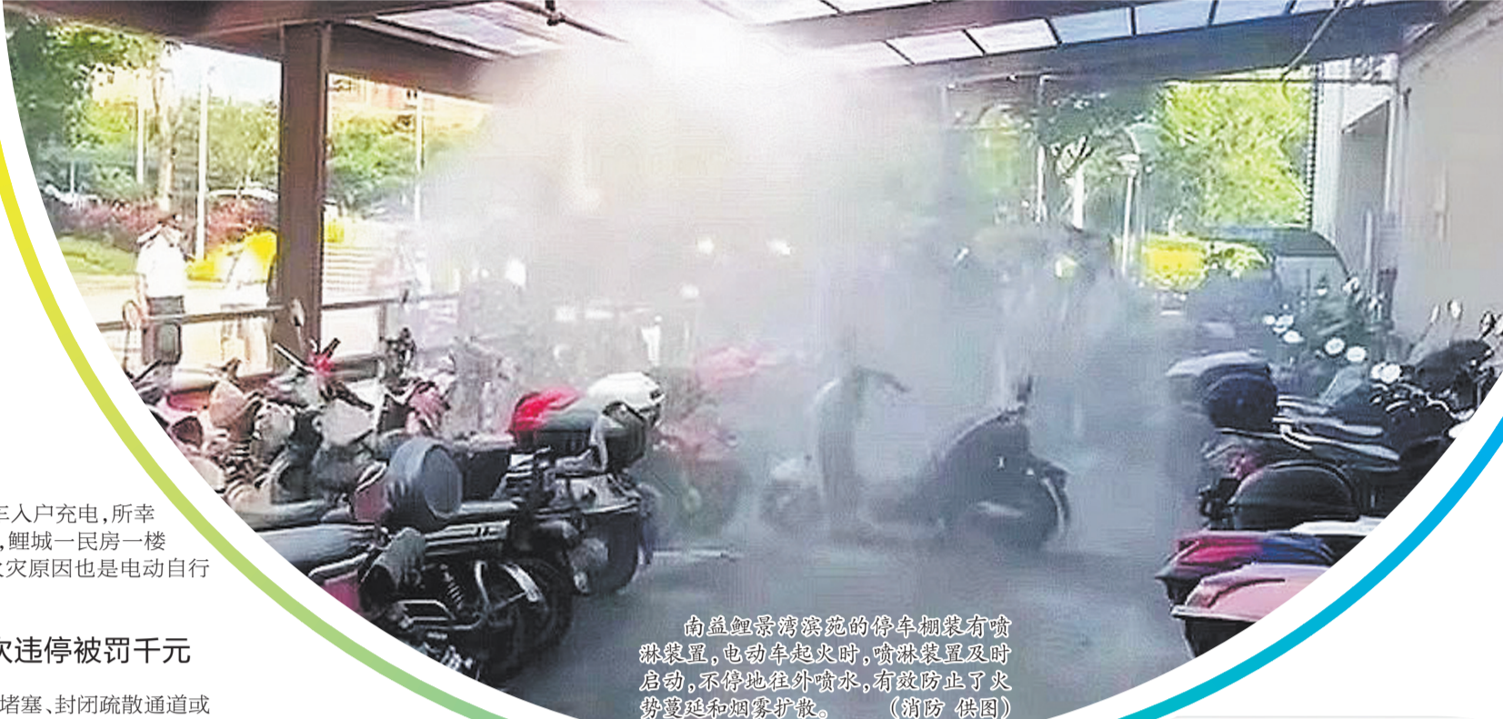
南益鲤景湾滨苑的停车棚架有喷淋装置,电动车起火时,喷淋装置及时启动,不停地往外喷水,有效防止了火势蔓延和烟扩散。