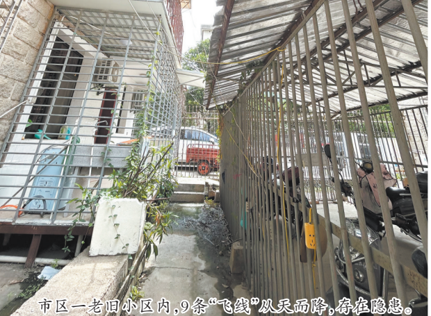
市区一老旧小区内,9条“飞线”从天而降,存在隐患。