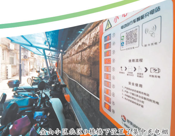
金山小区北区9栋楼下设置了集中充电棚