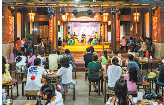
▲《世遗南音》 国庆假期,泉州府文庙内热闹非凡,市民围坐在一起欣赏南音演奏,一杯清茶、一份点心,沉醉在泉州特有的艺术曲调中。