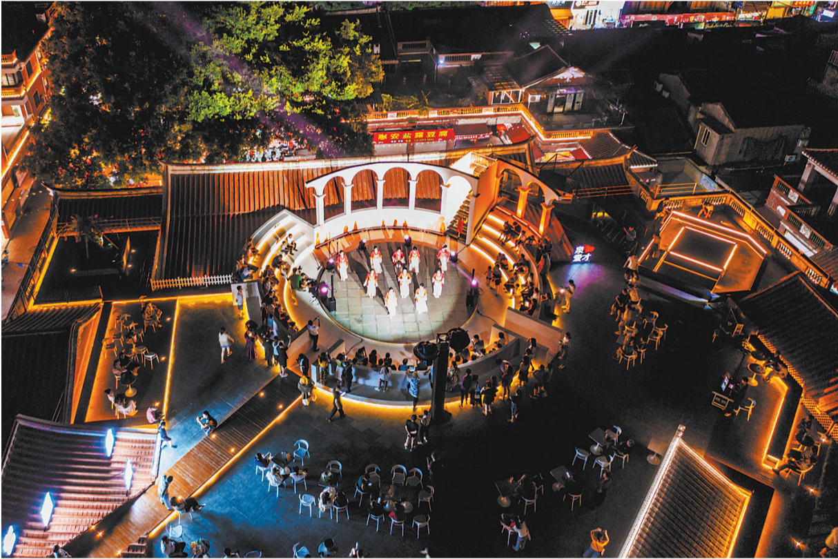
▲《视听盛宴》 在西街老菜场天台上举办的音乐表演,带给市民朋友热情似火的视觉盛宴。

福建省华光摄影艺术博物馆建筑面积8700平方米,集展览、学术、公众美育教育、馆藏、当代影像研究、网站与杂志出版为一体。