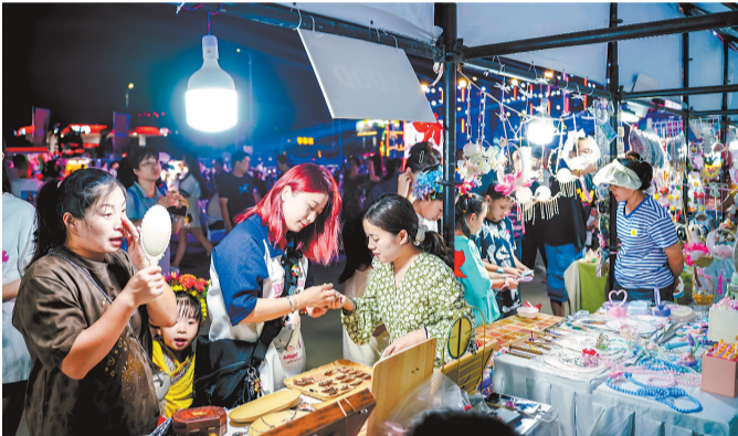
▲《渔家灯火》 在灯火璀璨的渔人码头上,各地游客在感受簪花文化的同时,品尝美食、挑选商品,尽情享受夜市带来的乐趣。