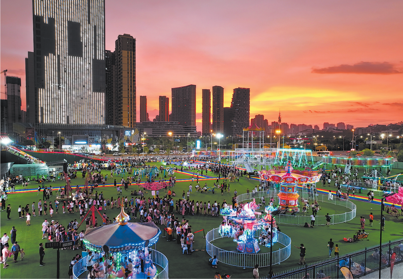
▲《夜游海丝乐园》 位于市区东海的泉州海丝乐园人气火爆,人们沉浸在丰富多彩的活动中,乐享假日休闲时光。