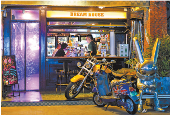
▲《松池有度》 西街是古城泉州流量担当,西街后半段的小酒馆深受不少年轻人喜爱,小酌几杯体验泉州慢生活。