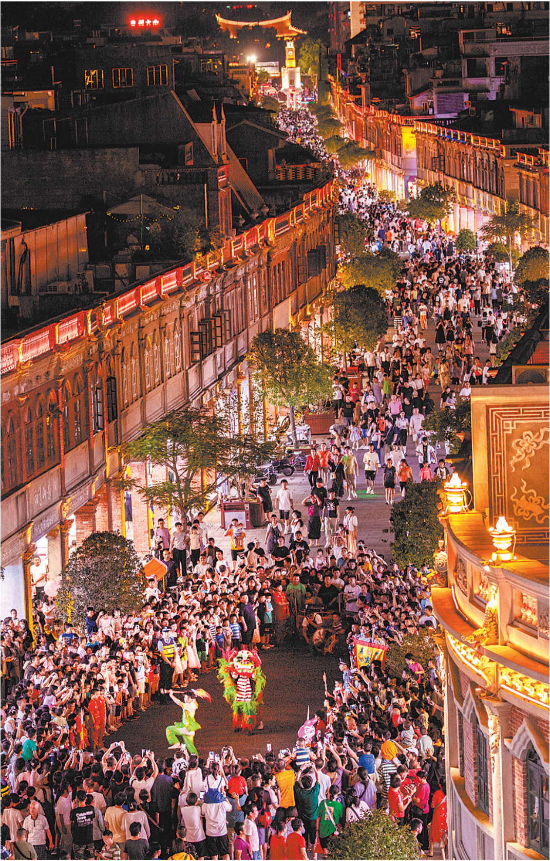
▲《沉浸式夜游》 中山路“快闪”活动精彩不断,青狮表演活灵活现,吸引了众多市民前来观看。