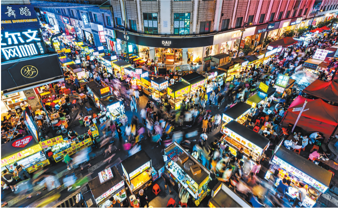
▲《十字街头》 夜幕降临,晋江青阳夜市十字街头灯火通明、人声鼎沸,市民穿梭在夜市里寻找舌尖上的美味。 (王沧海 摄)

世遗泉州的夜——热闹非凡,点燃了别样的烟火气,点亮了非凡的“夜经济”。 (彭燕珍)