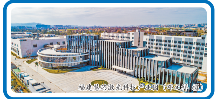
福建慧芯激光科技产业园

“创新是行业进步不竭的动力,创新是企业永恒的主题。要实现企业发展稳中向好、进中提质,关键要靠创新。进口芯片短缺给了国产芯片巨大的机会,但是打铁还需自身硬,只有依靠不断地投入与创新,才能抓住机会。”福建慧芯激光科技有限公司董事长东林表示。