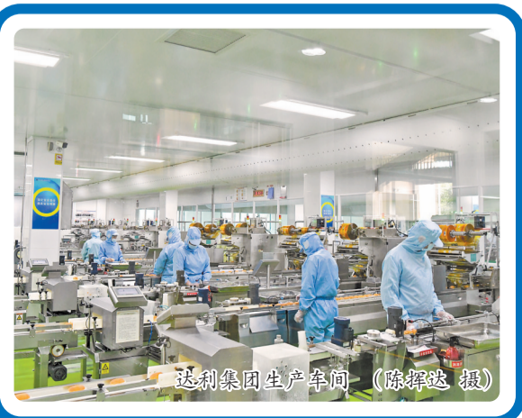
达利集团生产车间