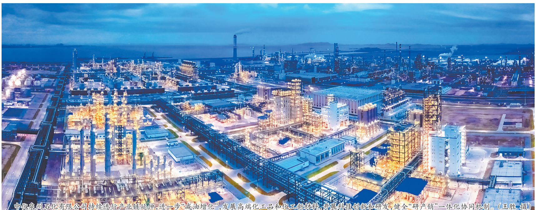
中化泉州石化有限公司持续进行产业链延伸,进一步“减油增化”,发展高端化工品和化工新材料,开展科技创新研发,健全“研产销”一体化协同机制。