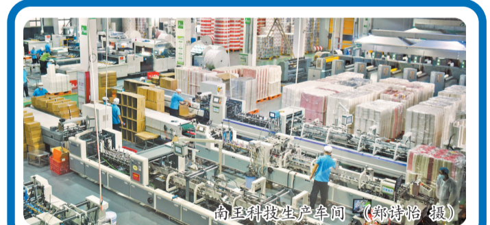
南王科技生产车间 (郑怡怡 摄)

“对标国际龙头,我们还有很多工作要做。”南王科技常务副总裁王仙房表示,南王科技将不断创新,致力实现“领跑行业,成为世界级品牌最信赖的合作伙伴”的企业愿景,将纸袋文化传播到全国,走向世界。