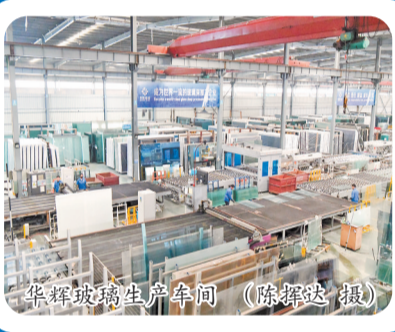
华辉玻璃生产车间

何惠彬高级工程师以福建省科技特派员的身份被派往泉州市科盛包装机械有限公司。入驻企业后,何惠彬带领该公司的技术人员攻克了一个个技术难关。“作为科技特派员,与企业同心协力开展技术创新,攻克难关,让研发成果找到了转化的‘试验田’。”何惠彬表示。