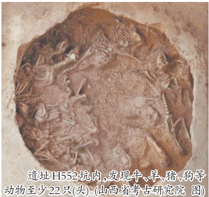
遗址H552坑内,发现牛、羊、猪、狗等动物至少22只(头)。

考古人员认为,兽骨坑H552非常有特色,该坑犬3颈椎处发现的素面鬲足,指示其时代为二里岗下层。此坑临近冶铜遗址核心区,应与冶铜手工业密切相关的大型祭祀活动遗存,为研究冶铜手工业面貌提供了新的视角,是探索二里岗时期手工业祭祀的难得材料。