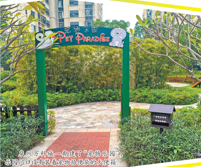
泉州万科城一期建了“宠物乐园”,乐园门口设有装着宠物拾便袋的犬便箱。