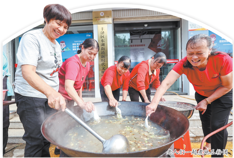
老人们一起煮地瓜粉圆

一道道菜肴逐渐上桌,30多名老人边吃边聊天,屋内不时传出愉快爽朗的笑声。据悉,每年重阳节,凤山社区都会组织敬老尊老爱老活动。今年,社区创新形式,把老人们聚在一起办个“重阳宴”,让大家在享受闽南特色美食的同时,话话家常,增进邻里感情。