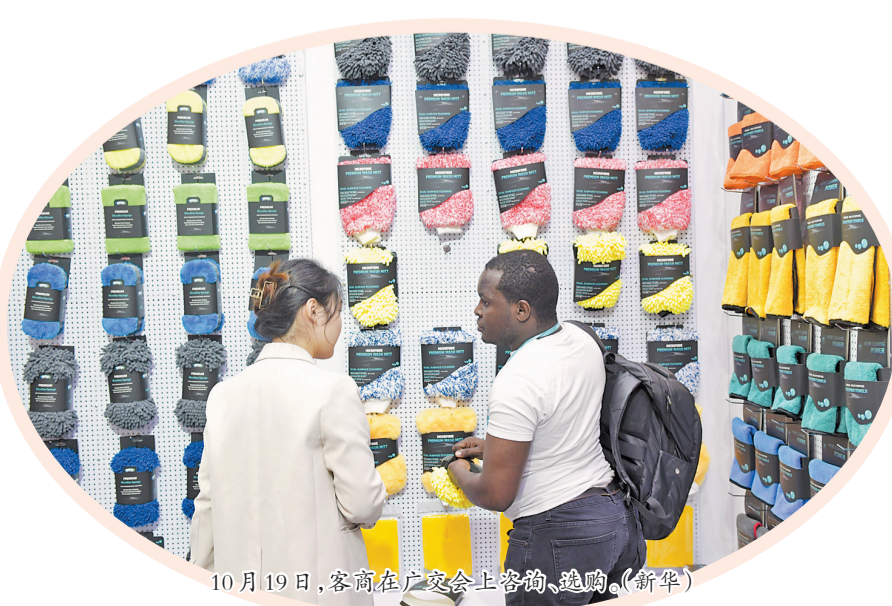
10月19日,客商在广交会上咨询、选购。