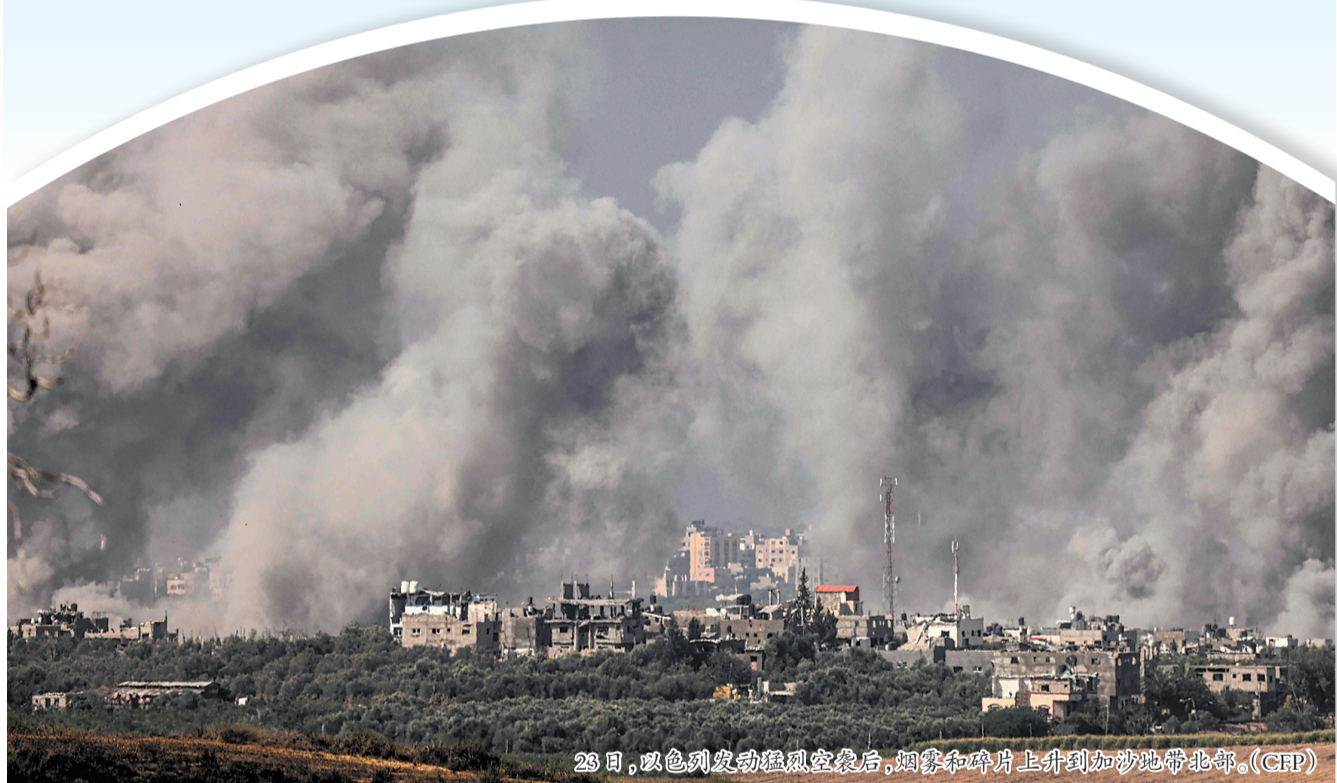
23日,以色列发动猛烈空袭后,烟雾和碎片上升到加沙地带北部。