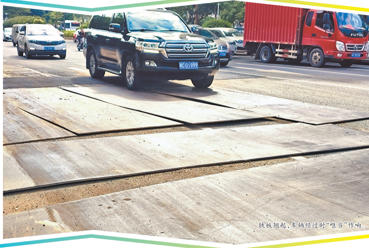
铁板翘起,车辆经过时“哐当”作响。

“最近小区楼下昼夜响个不停,已经持续了整整一周。”昨日上午,市民陈先生致电本社24小时热线96339反映,他所住的东海泰禾首玺小区近期周边都在破路施工,令小区居民纳闷的是,除了破路时的扰民,有一处路面挖开后铺了6块铁板,这些铁板不仅翘起存在危险,车辆经过时更是“哐当”作响,而且已经持续了一个多礼拜。