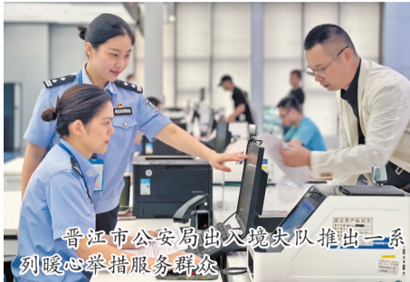
晋江市公安局出入境大队推出系列暖心举措服务群众

本报讯(记者张晓明 通讯员黄子龙文/图)今年1月8日国家移民管理局优化移民管理措施以来,出入境窗口的办证量出现“井喷”。昨日,记者从晋江市公安局了解到,该局出入境管理大队党支部紧紧围绕“让党中央放心、让人民群众满意的模范机关”创建工作,让群众能享受更加优质高效的服务,多措并举应对,不断提升服务质量,让群众获得感幸福触手可及。