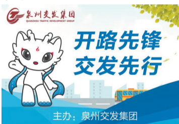
主办:泉州公交集团

引进人才是起点,用好人才是关键,留住人才是根本。成立以来,公交集团坚持从企业发展的“需求侧”着眼,从队伍建设的“供给侧”发力,精准科学培育,集团各层级队伍发展呈现新气象;坚持全程服务理念,做强引才核心竞争力,不断完善和优化人才服务保障体系,积极打造“显见刺桐”人才公寓项目,出台《泉州公交集团引进人才待遇暂行规定》,让人才在交发生活待遇放心、工作环境舒心、干事平台顺心。