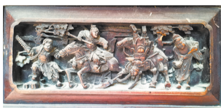
漆环板木雕三国演义场景