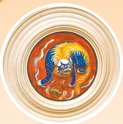
天花板灯圈泥塑彩绘瑞兽

进入大门,回首一望,却是闽南古厝“两进五开间二榀头带回向”的格局,共有26间房,以厅堂为中心,中轴对称,这是一种集居室、书房、祖厅、佛堂四位一体的建筑样式。厅堂是敬神祭祖、婚丧礼仪之所,门楣彩绘“八仙”,营造尊祖敬宗的肃穆氛围。一层厅堂挂满蔡家祖先遗像,二层供奉神明。内部钢筋水泥框架结构,置双十走廊,架左右双梯,设透天天井,天圆地方,通天达地,采光通风,体现中国“天地人合一”传统理念。