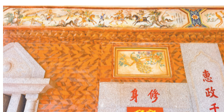
水车堵和门匾的彩绘