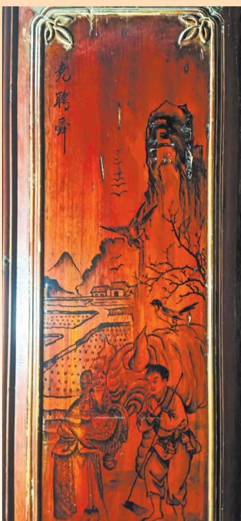
振成楼内窗枋工笔水墨画“尧聘舜”