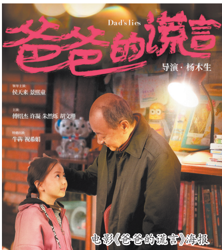
电影《爸爸的谎言》海报

无论是剧本创作、电影拍摄,还是后期制作、宣传发行,大量优秀青年电影人正投身国产电影生产各个环节。“‘90后’和‘00后’在图像化时代中长大,他们的图像表达能力比我们这代人强很多。”厦门大学电影学院常务副院长李锐红说,只要给予新生代电影人更多信任和时间,优秀的国产电影作品将源源不断问世。