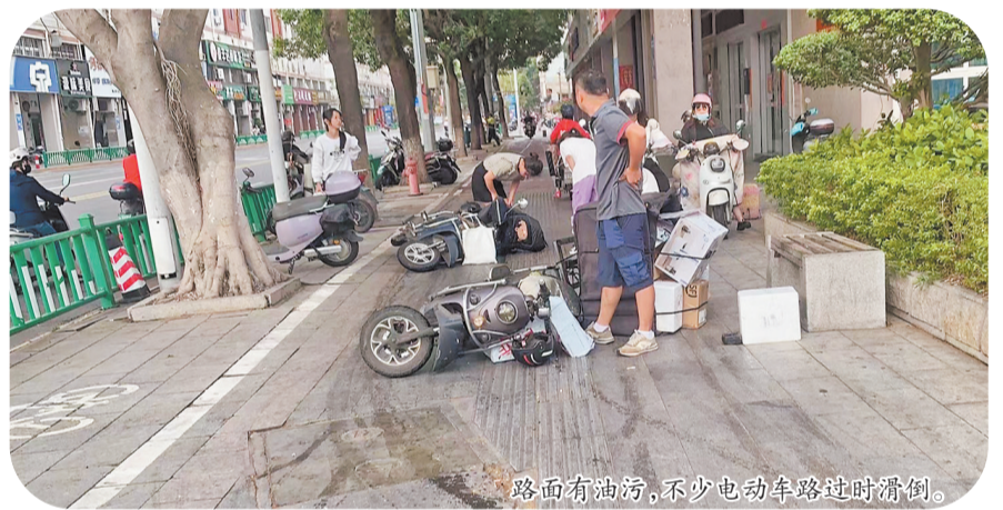
路面有油污,不少电动车路过时滑倒。

据了解,这段油污路面大概有几十米长,从田安北路与湖心街路口延伸到花园酒店路口,短短一段时间,就有30多辆电动车在此处摔倒。现场市民推测,油污可能是泔水车滴落的。上午10时许,油污路面清理完毕,道路恢复正常通行。