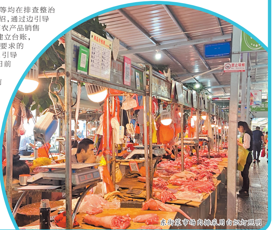
东街菜市场肉摊采用白炽灯照明

据了解,今年9月至今,通过前期宣传和引导,各县(市、区)已先行督促辖区内主要大中型商超、农贸市场停止使用“生鲜灯”。截至目前,全市已全面停用“生鲜灯”的商超25个、农贸市场猪肉(牛)肉摊位120余个。12月1日至10日为重点整治阶段,对整改不到位的经营主体、食用农产品销售量较大、群众投诉线索较多的经营主体,市场监督管理部门将依据《食用农产品市场销售质量安全监督管理办法》第三十八条规定,责令改正并予以警告;拒不改正的,处五千元以上三万元以下罚款。