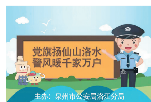
主办:泉州市公安局洛江分局

据了解,目前辖区已有600余份反诈快递被投递到网购消费者手中,“双十一”购物节前后,此工作还将持续开展,河市派出所努力从源头上做实防范管理,实现“精准滴灌”,更加有效地降警情、控发案。